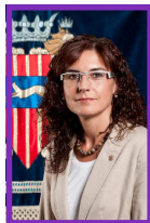
Mercè Dalmau Mallafre Alcaldesa Ajuntament de Cambrils

El dia 25 de novembre commemora la necessitat de continuar treballant i lluitant per eradicar la violència de gènere en tots els àmbits de la societat, els maltractaments i assassinats a les llars, les violacions, l'agressió sexual i la violència en general contra les dones.