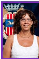
Lluïsa Rom Sala Regidora de Benestar Social, Salut i Família.

Des d'aquestes línies us animo a participar en les diverses activitats que conformen el programa d'actes d'aquestes jornades que ens han de servir perquè les institucions i la ciutadania continuem treballant conjuntament per la construcció d'una societat on la violència no tingui cabuda.