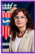
Mercè Dalmau Mallafré Alcaldesa Ajuntament de Cambrils

El dia 25 de novembre commemora la necessitat de continuar treballant i lluitant per erradicar la violència de gènere en tots els àmbits de la societat, els maltractaments i assassinats a les llars, les violacions, l'agressió sexual i la violència en general contra les dones.