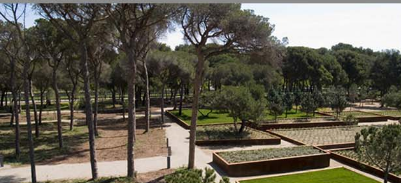
PARC DEL PINARET