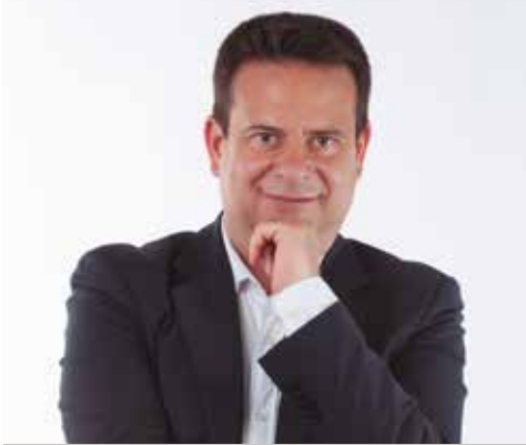
Oliver Klein Bosquet Alcalde de Cambrils