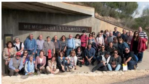
Sortida cultural als espais de la batalla de l'Ebre

Finalment destacar que el cicle La victòria fou el silenci ha permès al Museu d'Història de Cambrils i a l'Arxiu Municipal de Cambrils continuar aportant elements per conèixer i valorar el patrimoni cultural en aspectes poc coneguts de la història contemporània del municipi. Tot plegat forma part de la línia de recerca i divulgació sobre memòria històrica que ambdues institucions desenvolupen dins de la seva programació. Des de l'any 2006, any rere any, aquests cicles de memòria de tardor obtenen una excel·lent resposta de la ciutadania.