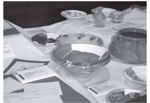
Alguns dels objectes i documents exposats

finançava), inventaris de la roba i dels objectes que hi havia, receptes de les medicines que comprava, les butlletes que havien de presentar les persones a qui es donava pa i carn, informes sobre l'estat de l'edifici (en un dels quals s'informa que només hi havia dos llits i els malalts estaven exposats al fred perquè les cambres no tenien portes i calia renovar el trespol). També s'hi pot veure l'única fotografia antiga que es coneix de la façana del carrer de Sant Plàcid, datada cap a 1900.