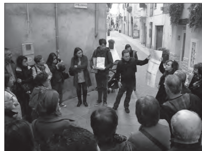
Al llarg de la ruta Espais d'escola es van anar presentant documents i objectes. A la imatge, els participants comenten un llistat d'alumnes en un dels llocs on hi va haver un col·legi

Tot plegat va anar esdevenint al llarg d'una conferència, dues taules rodones, una projecció d'imatges (que va esdevenir un taller participatiu d'identificació de fotografies) i una ruta històrica (comentada per l'Arxiu Municipal de Cambrils i el Museu d'Història de Cambrils) que va permetre descobrir usos escolars en diferents espais urbans, amb el suport de documents, objectes i testimonis de persones.