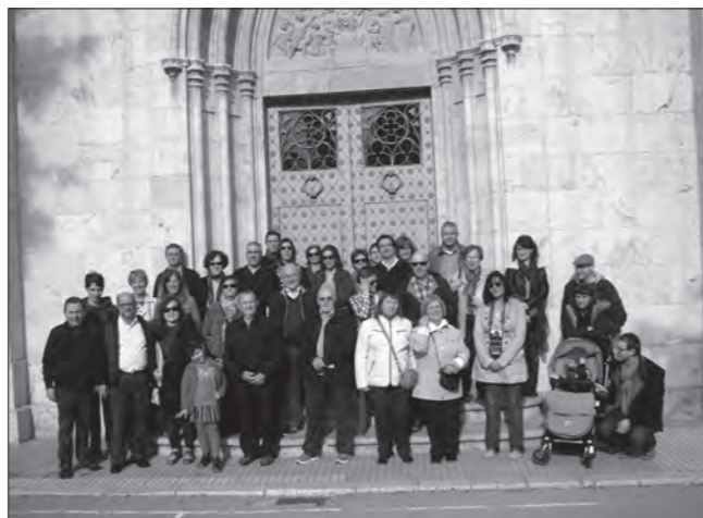
Els participants a la ruta es van retratar al lloc tradicional on es feien les fotografies de grup dels alumnes del col·legi dels Hermanos , la porta de la capella