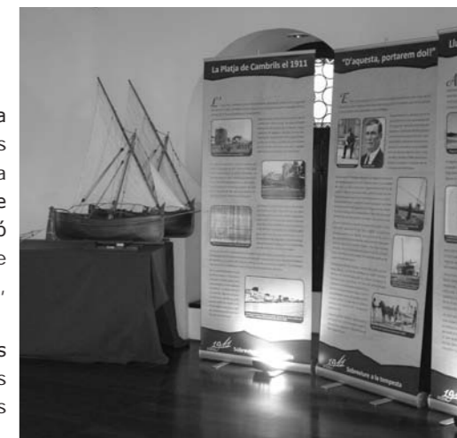
Part dels plafons i objectes exposats AMCAM

Aquest tipus d'esbossos són relativament habituals en els llibres d'època medieval i moderna. Ens permeten conèixer aspectes de la vida quotidiana dels qui els escrivien o els utilitzaven.