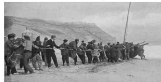
Rescat d'una embarcació a la platja de Can Tunis, a Barcelona

FOTO: BALLELL. PUBLICAT A IL·LUSTRACIÓ CATALANA (FEBRER DE 1911)