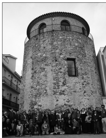
Participants a la ruta comentada

Les diferents activitats del cicle Societats de Cambrils durant la II República van tractar de la importància que tenien les societats com a protagonistes i impulsores de la vida social, econòmica, cultural, lúdica i política a Cambrils fins a l'any 1939. Els testimonis que van participar a les conferències, la taula rodona i la ruta comentada van parlar de balls, de tertúlies als cafès, de solidaritat interna, de tardes de cinema, de suport a la pesca, de festes i d'escoles.