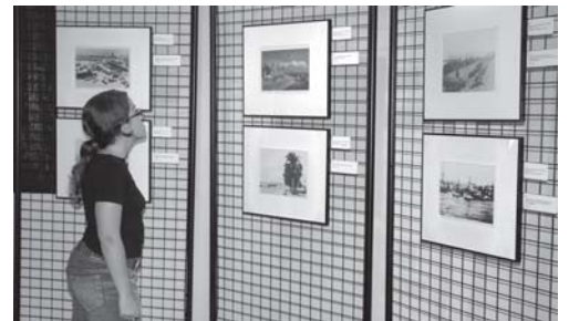
Imatge de l'exposició.

Les fotografies estan datades aproximadament entre inicis del segle XX i l'any 1975. Procedeixen de col·leccionistes particulars, que en diferents moments n'han cedit una reproducció a l'arxiu per tal de contribuir a la seva divulgació i al coneixement del patrimoni cultural de Cambrils.