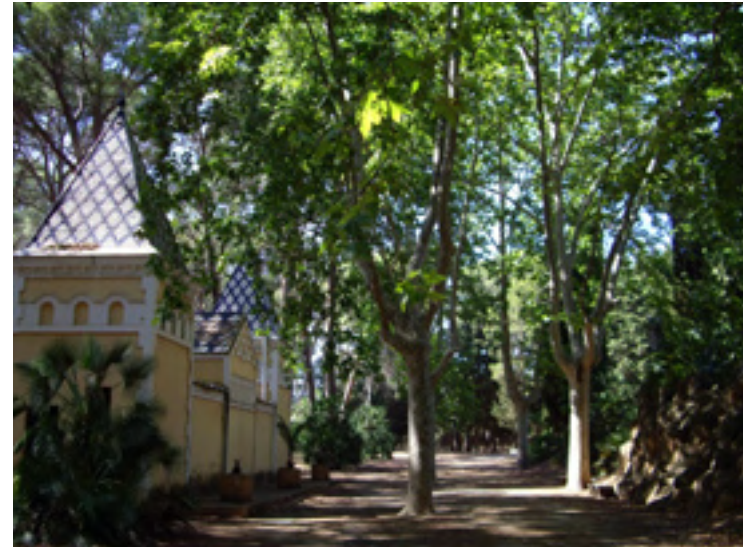
Parc Samà.