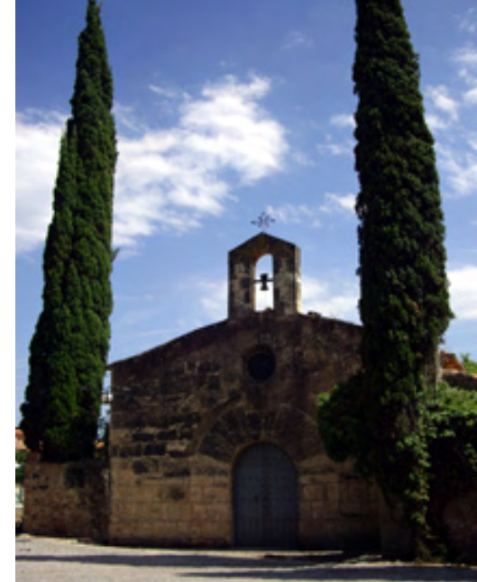
L'ermita de mas d'en Bosch.