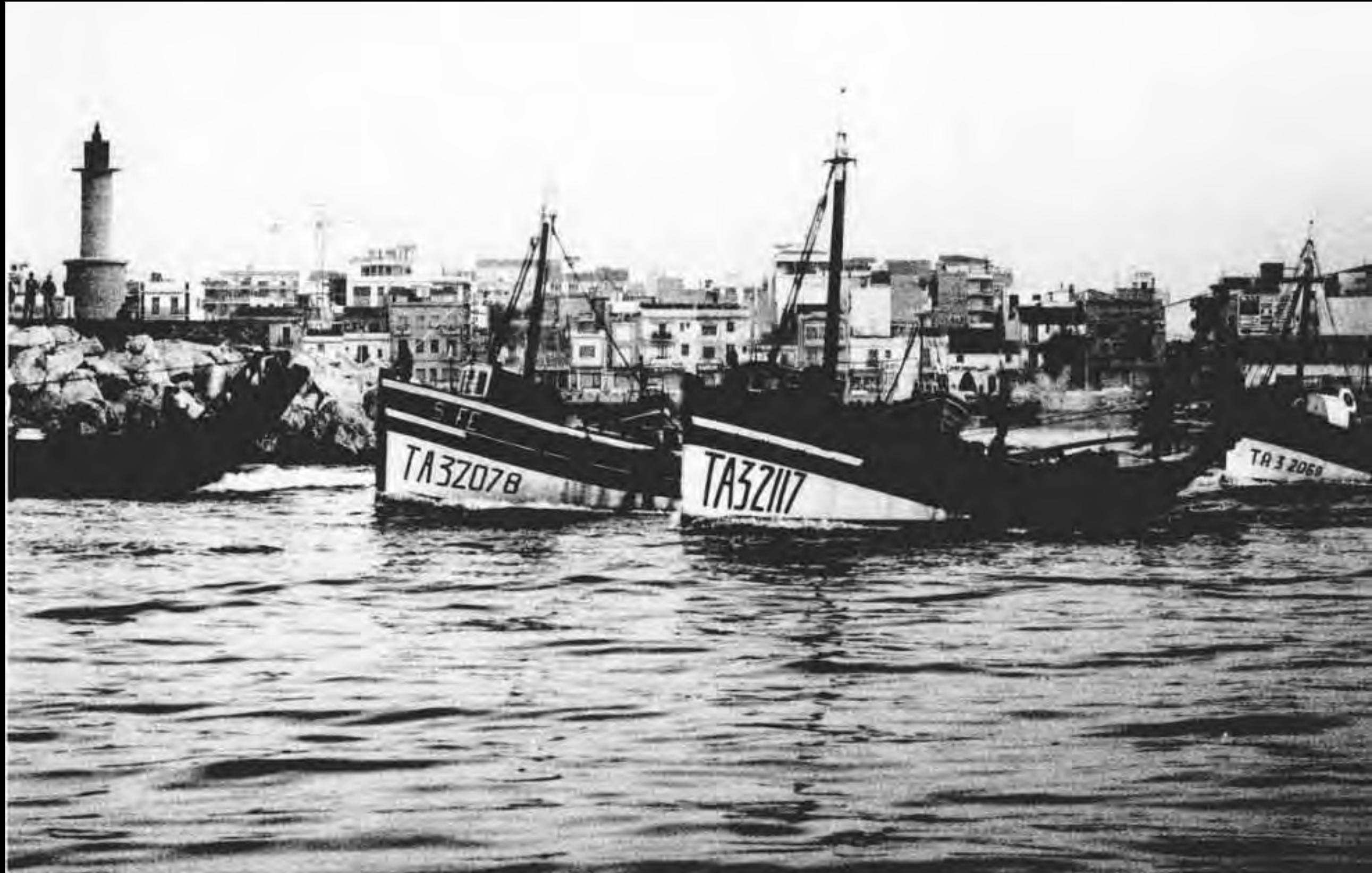
Bocana del port de Cambrils a primera hora del matí, amb la sortida de les barques de l'arrossegament.