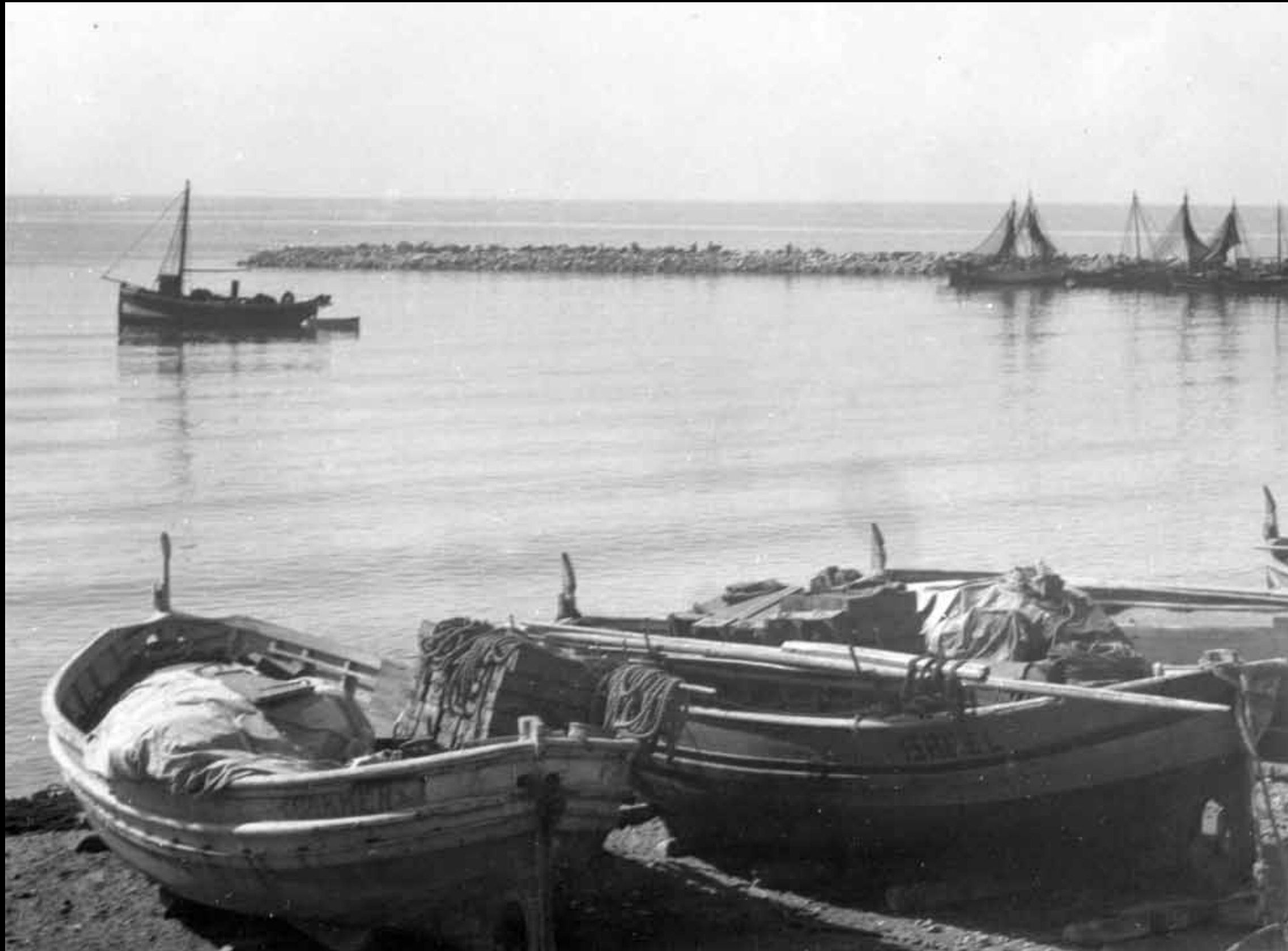
El Soral amb barques tretes i diferents quillats al mig del port.