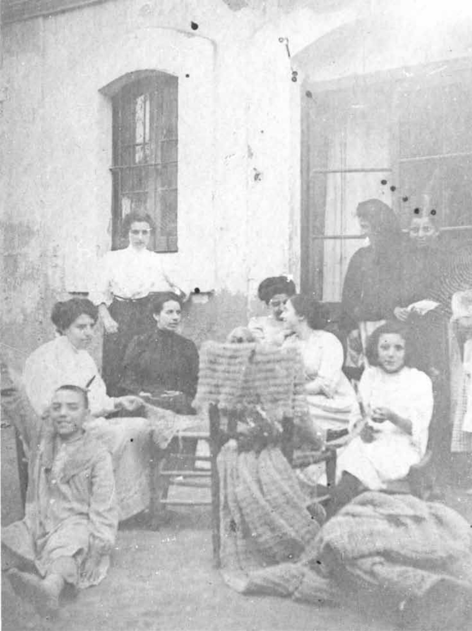
Dones remendant sàrcies (entre 1900 i 1920)

Arxiu Municipal de Cambrils. Núm. Reg. 7796-23