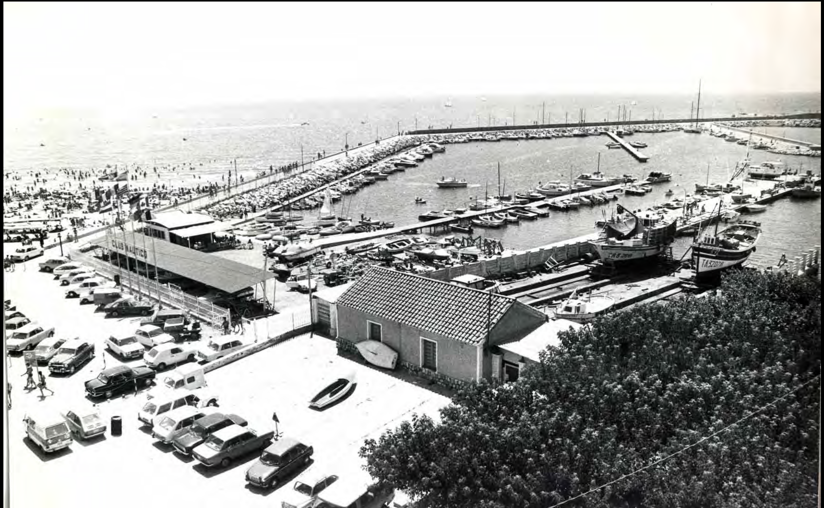
Imatge aèria del Club Nàutic i de la platja del Prat d'en Forés. A la dreta, el varador.