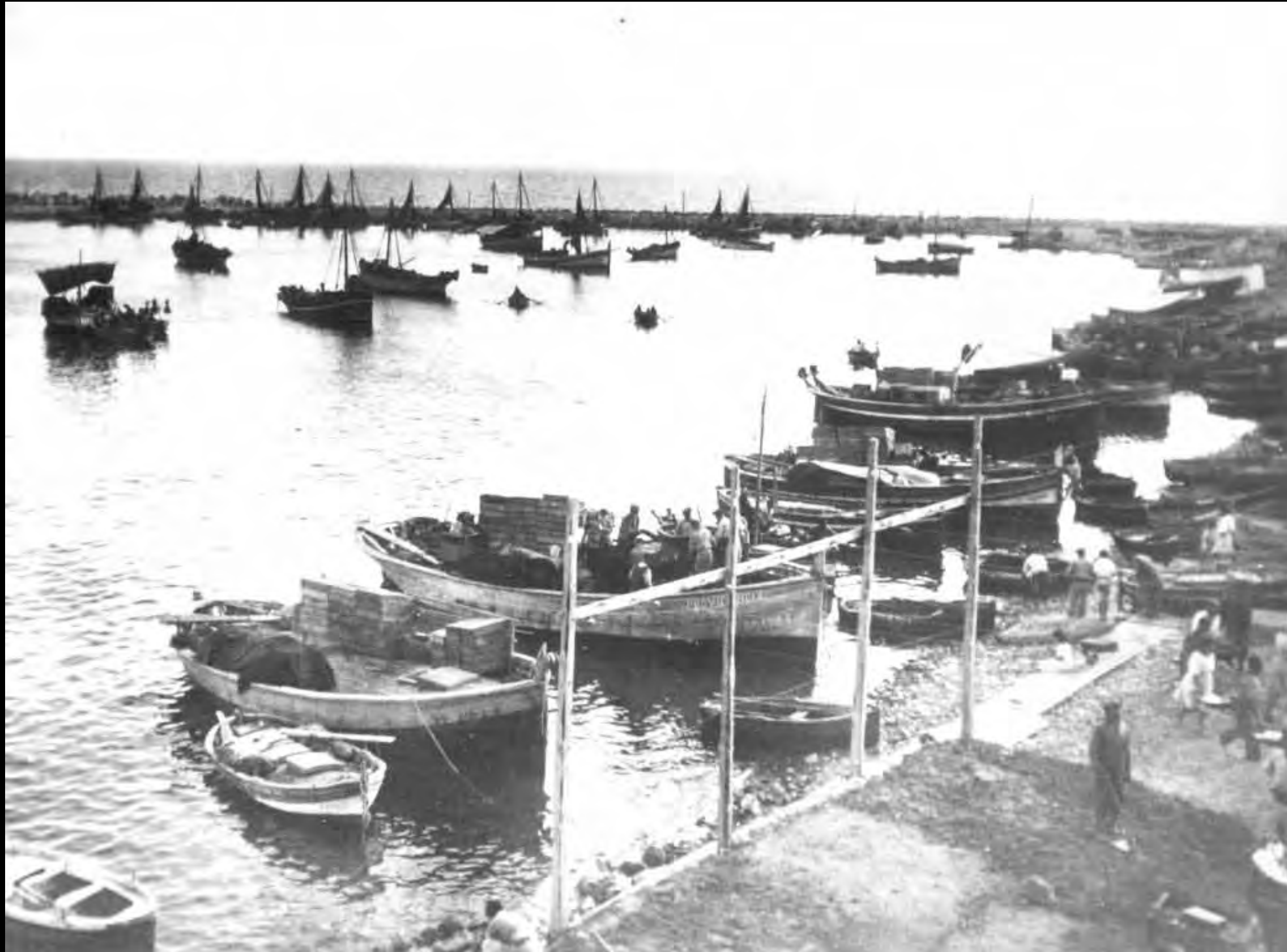
Arribada de les barques de l'arrossegament i descàrrega del peix al Mollet. En primer terme, barques de l'encerclament. La imatge se situa cap a 1936, ja que s'hi entreveu el port encara en construcció.

Núm. Reg. 7797-3-6