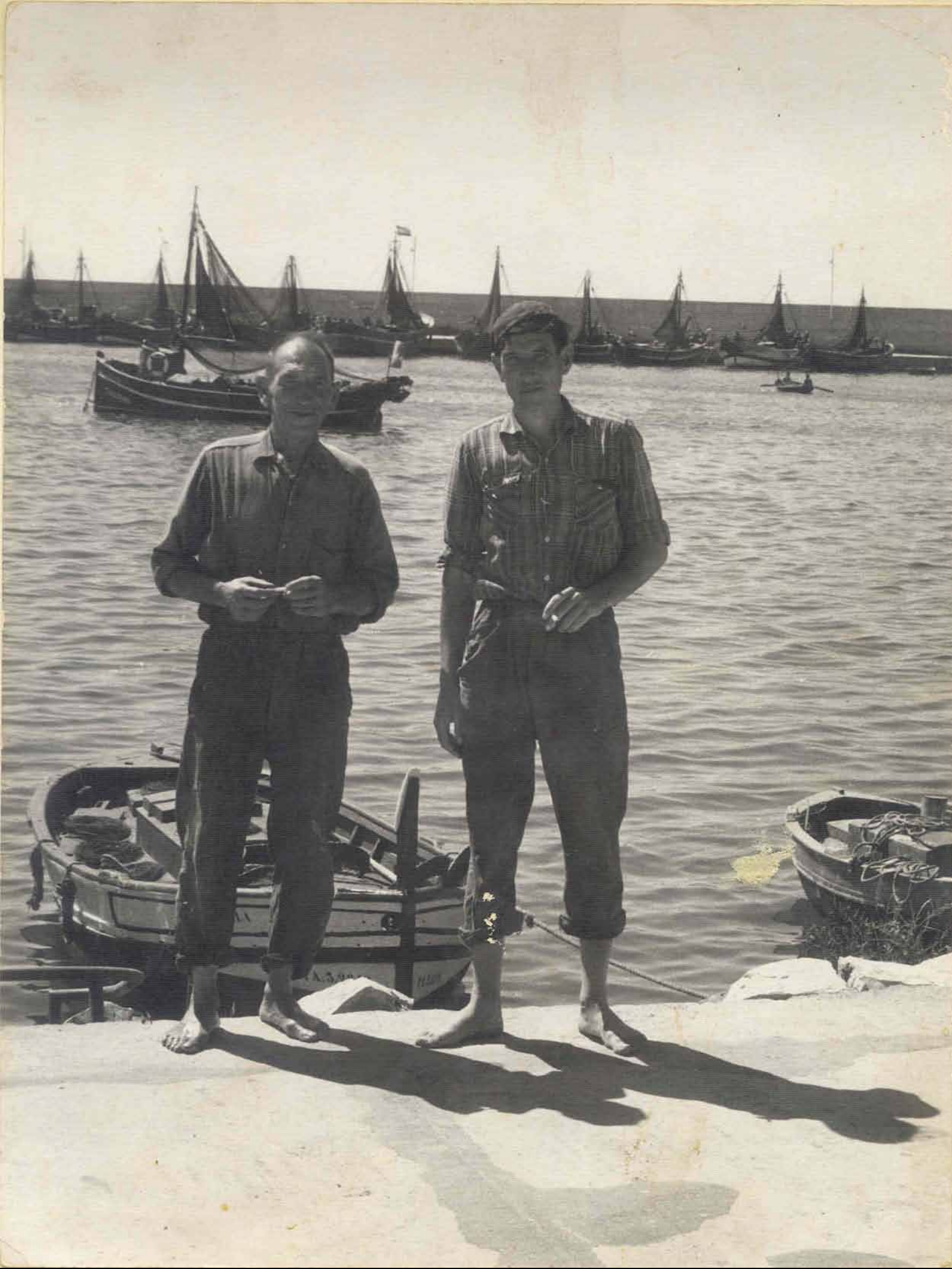
Dos pescadors al moll