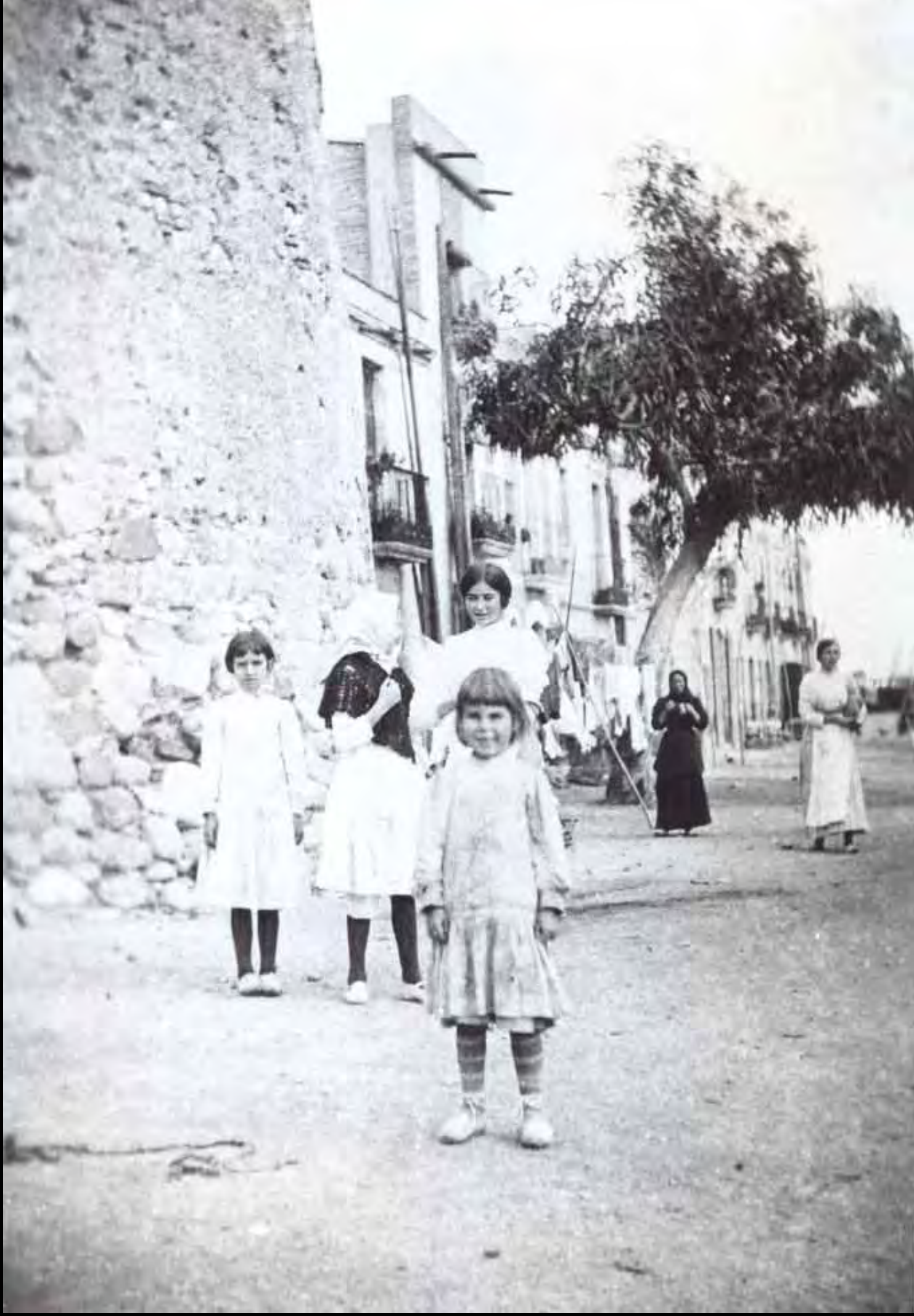
Dones de diferents edats davant de la Torre del Port (abans de 1920)

Núm. Reg. 7794-22