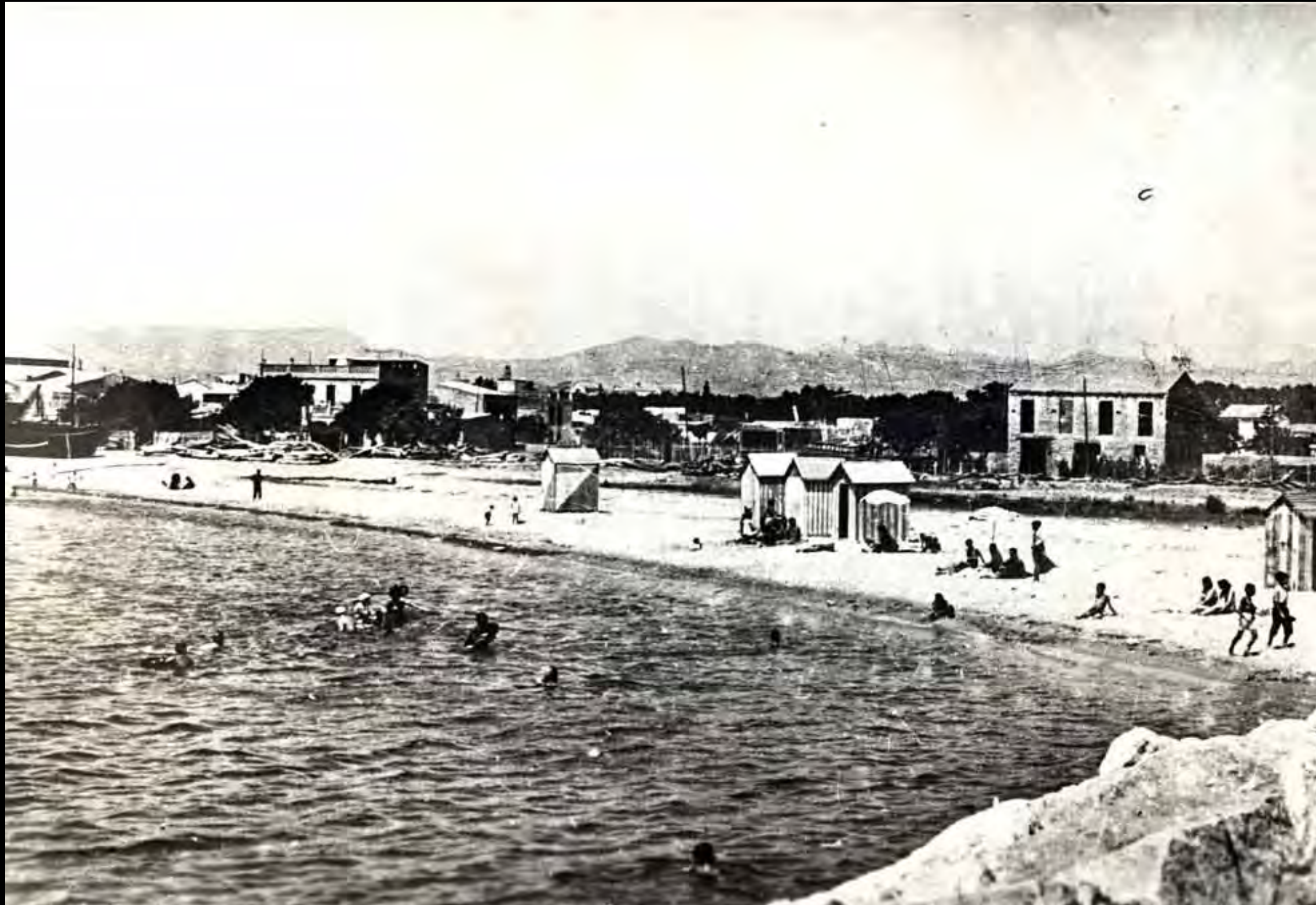
Extrem de llevant del port, amb les casetes dels banyistes. A la dreta, l'inici del moll de llevant, al punt ocupat avui pel Club Nàutic. A l'esquerra s'hi aprecien les drassanes del Vives.