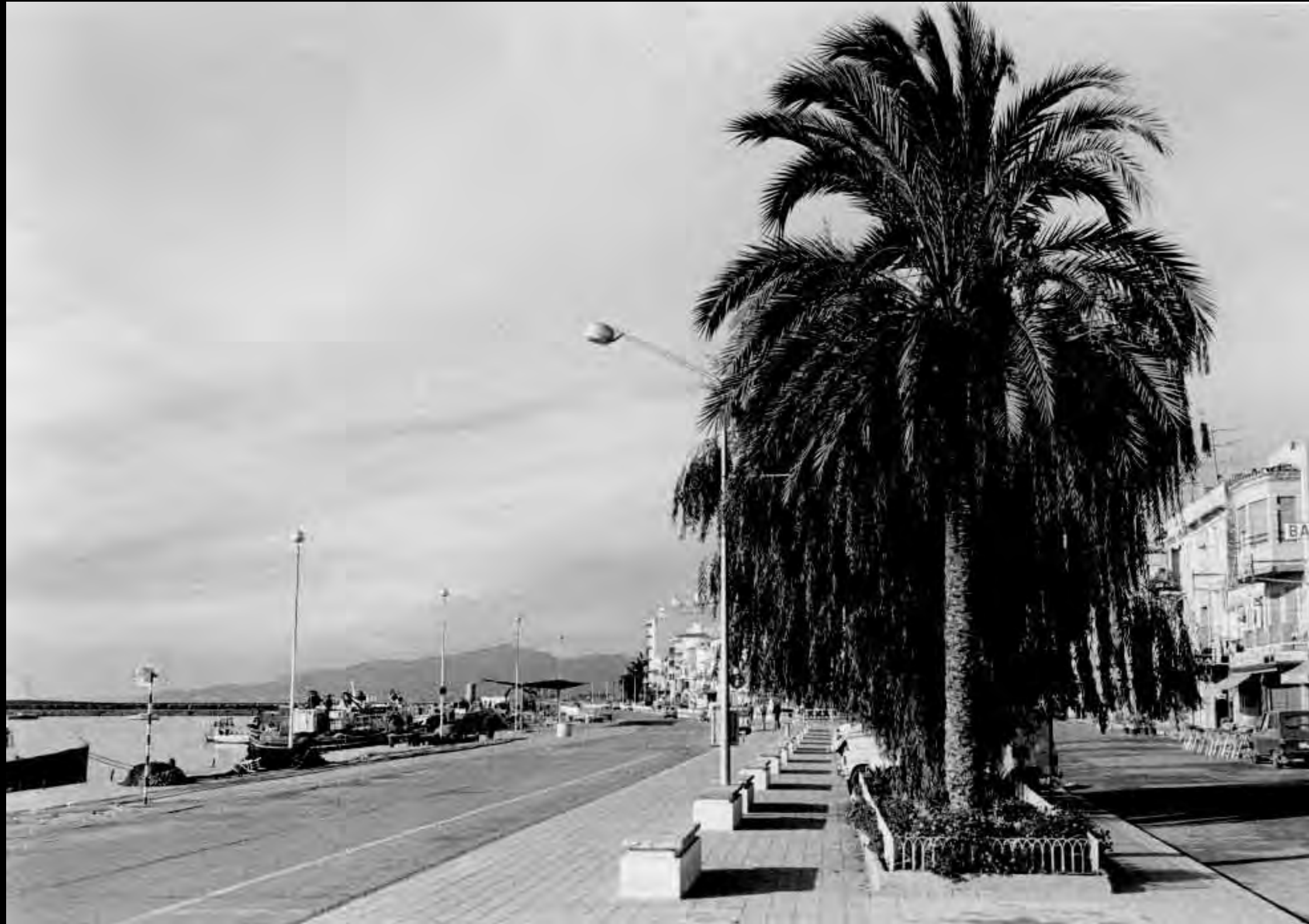
Carrer Consolat de Mar, davant del port.