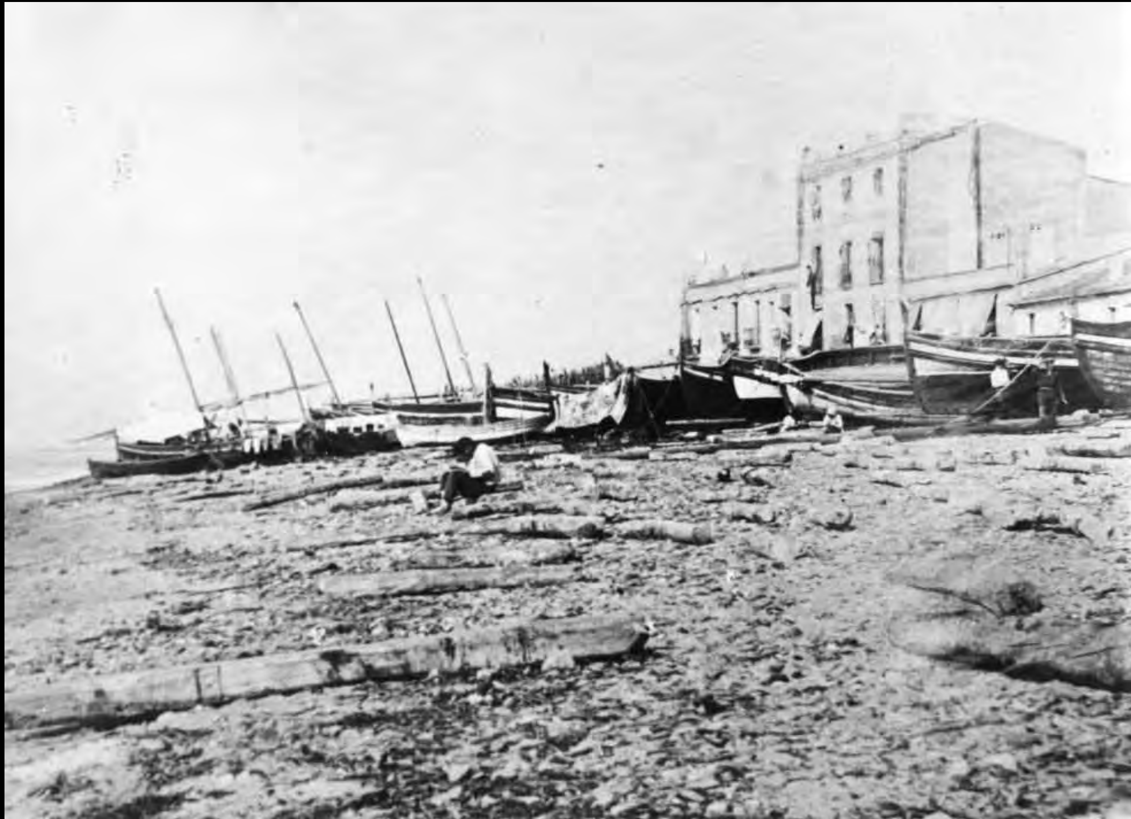
El Soral amb barques tretes i les darreres cases de garbí.