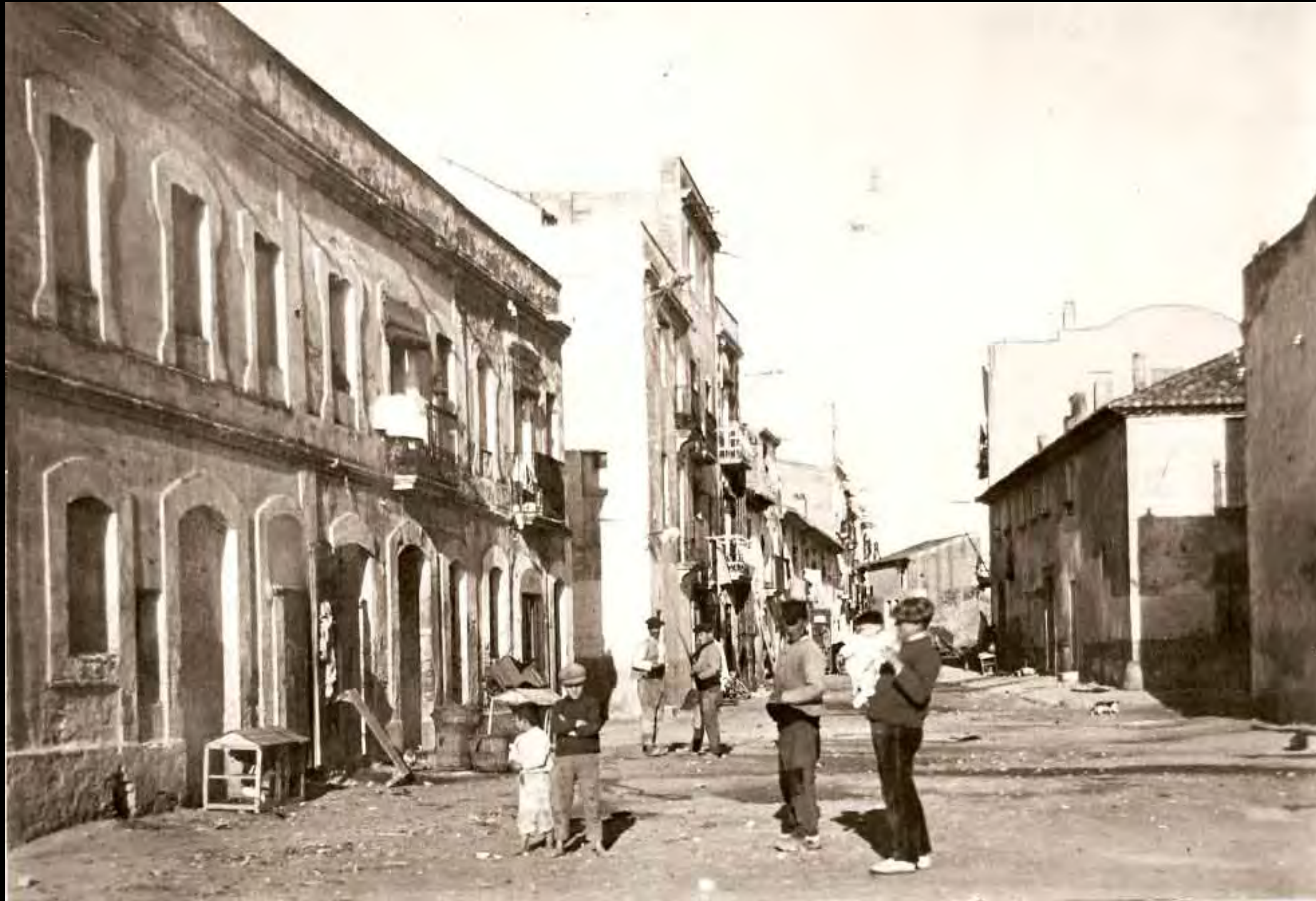
Carrer de Sant Jordi, vist d'esquena al mar, possiblement un dia de festa a migdia. S'observa que els homes van amb sabates i esclops. Dècada de 1920

Núm. Reg. 7795-14