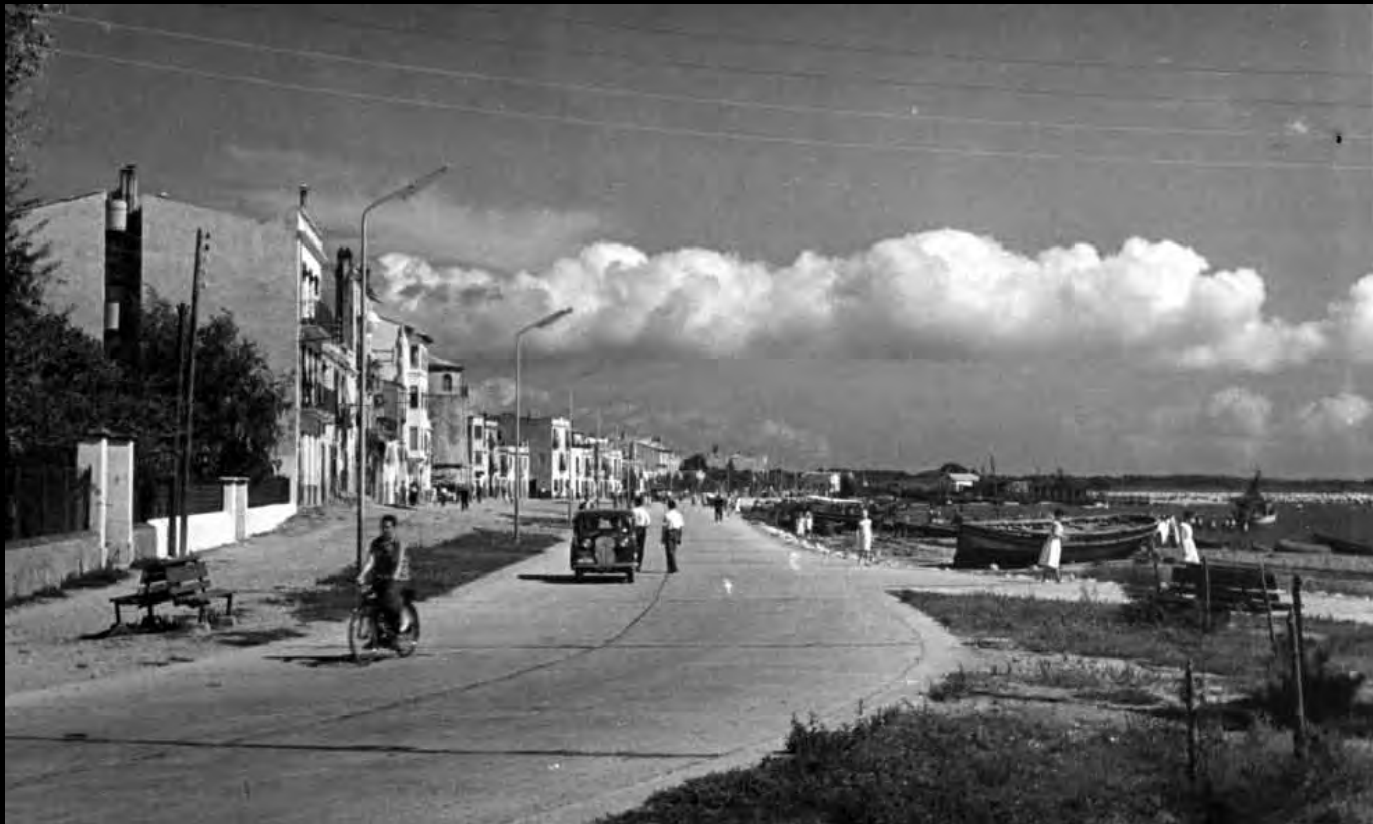
El Soral després de la construcció de la carretera del port.