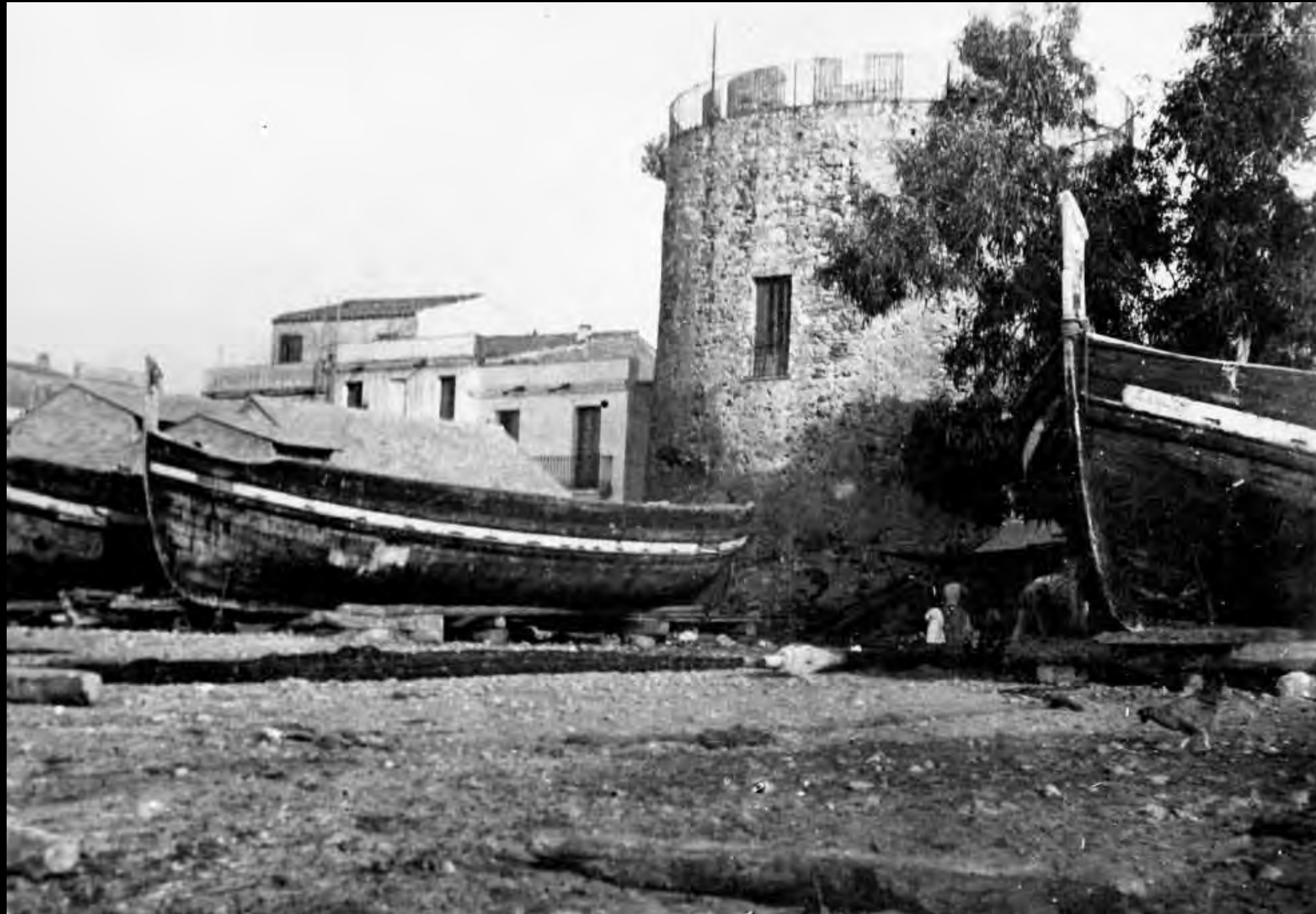
Embarcacions de pesca al bou, tretes davant de la Torre del Port i amb la vela llatina desarmada.