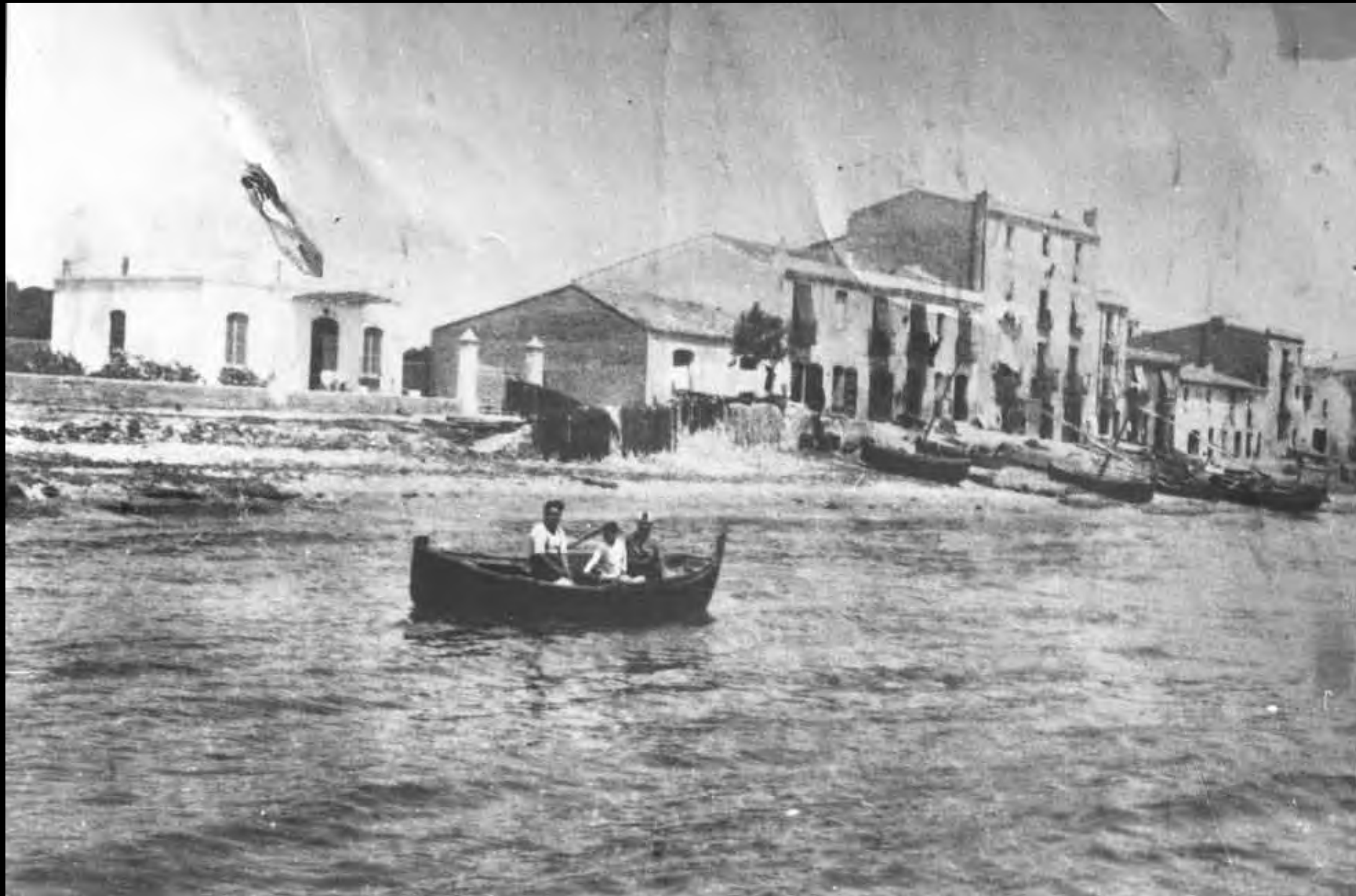
Inici del Sorral. En primer terme, bot de remos prop de la costa. Finals de la dècada de 1920

Arxiu Municipal de Cambrils. Núm. Reg. 7797-3-8