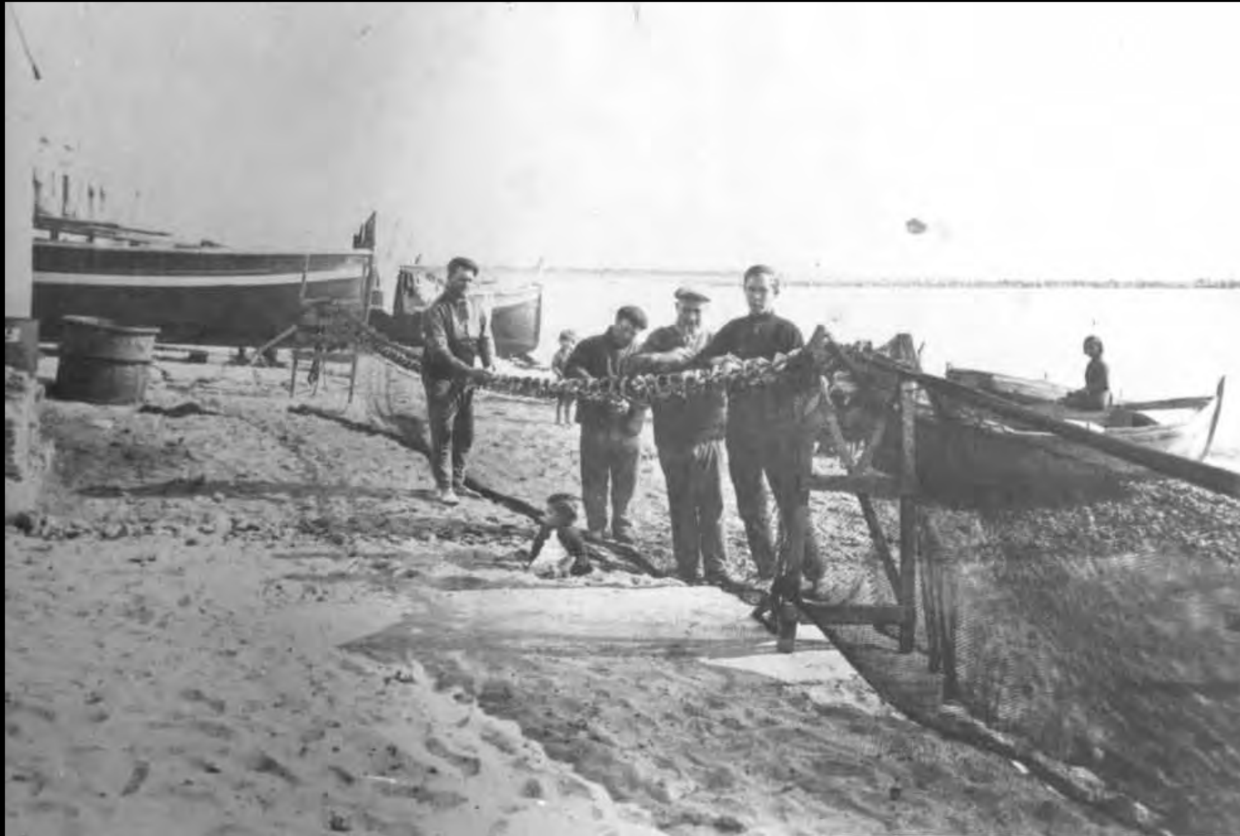
Netejant les sàrcies després d'haver-les desarmellat. Probablement, vora la casa de la maquinilla, davant de la torre del port (cap a 1936)

Arxiu Municipal de Cambrils. Núm. Reg. 7797-1