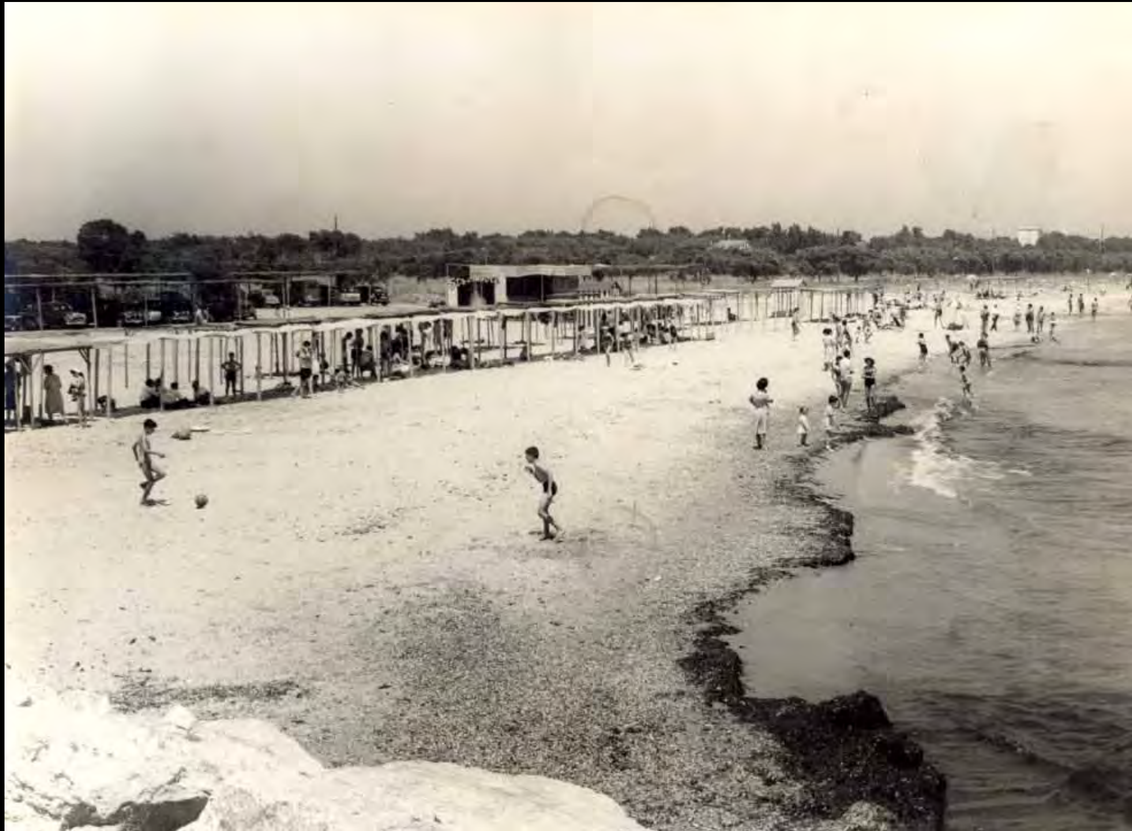
Imatge estiuenca de la platja del Prat d'en Forés amb els primers turistes.