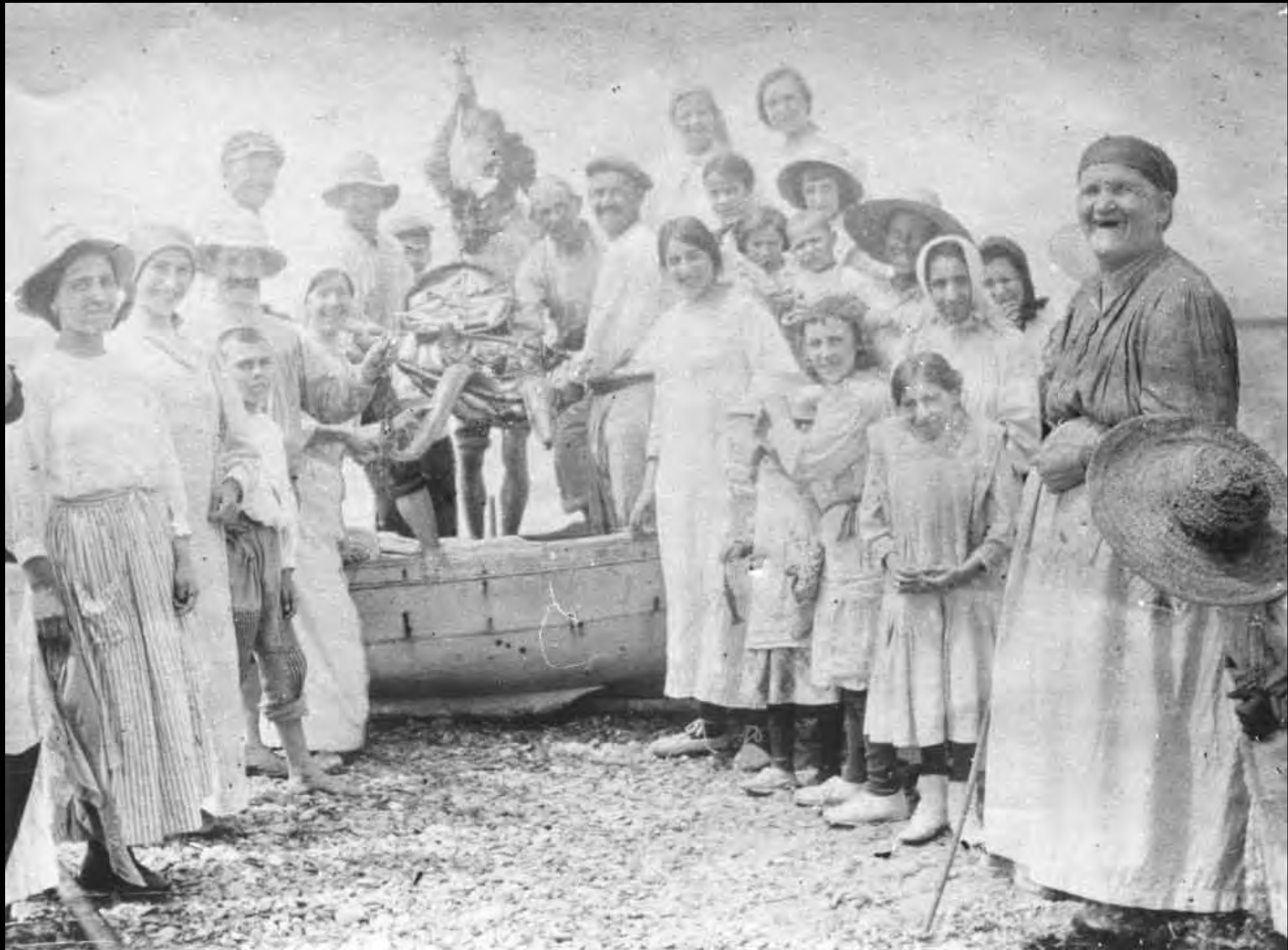
Grup de persones de la platja, mostrant una captura de peix (inici del segle xx)

Núm. Reg. 7796-9