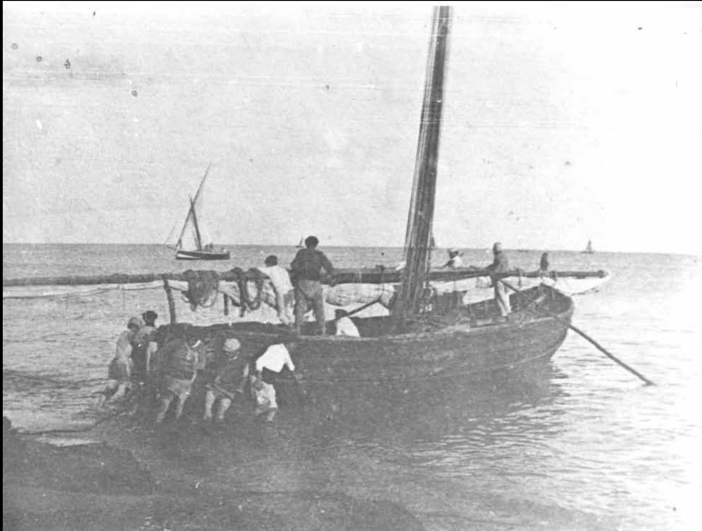
Grup de gent avarant un bastiment aparellat amb vela llatina (Inicis de la dècada de 1920)

Núm. Reg. 7795-20