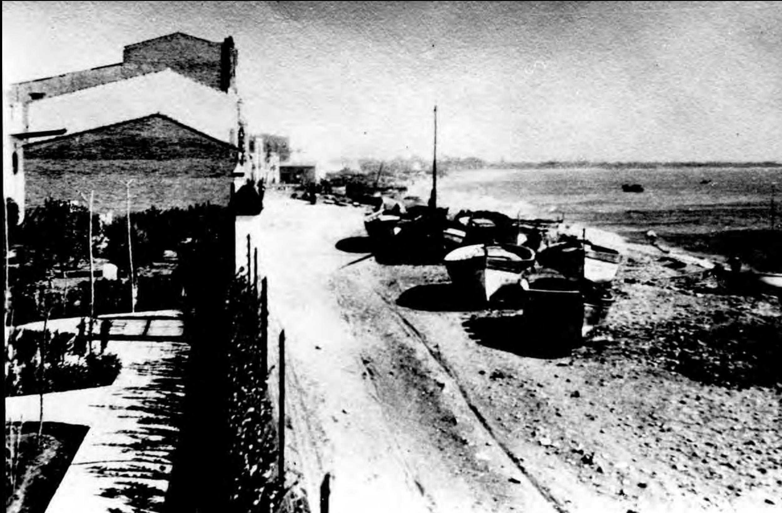
Barques tretes al Soral, algunes en estat d'abandonament.