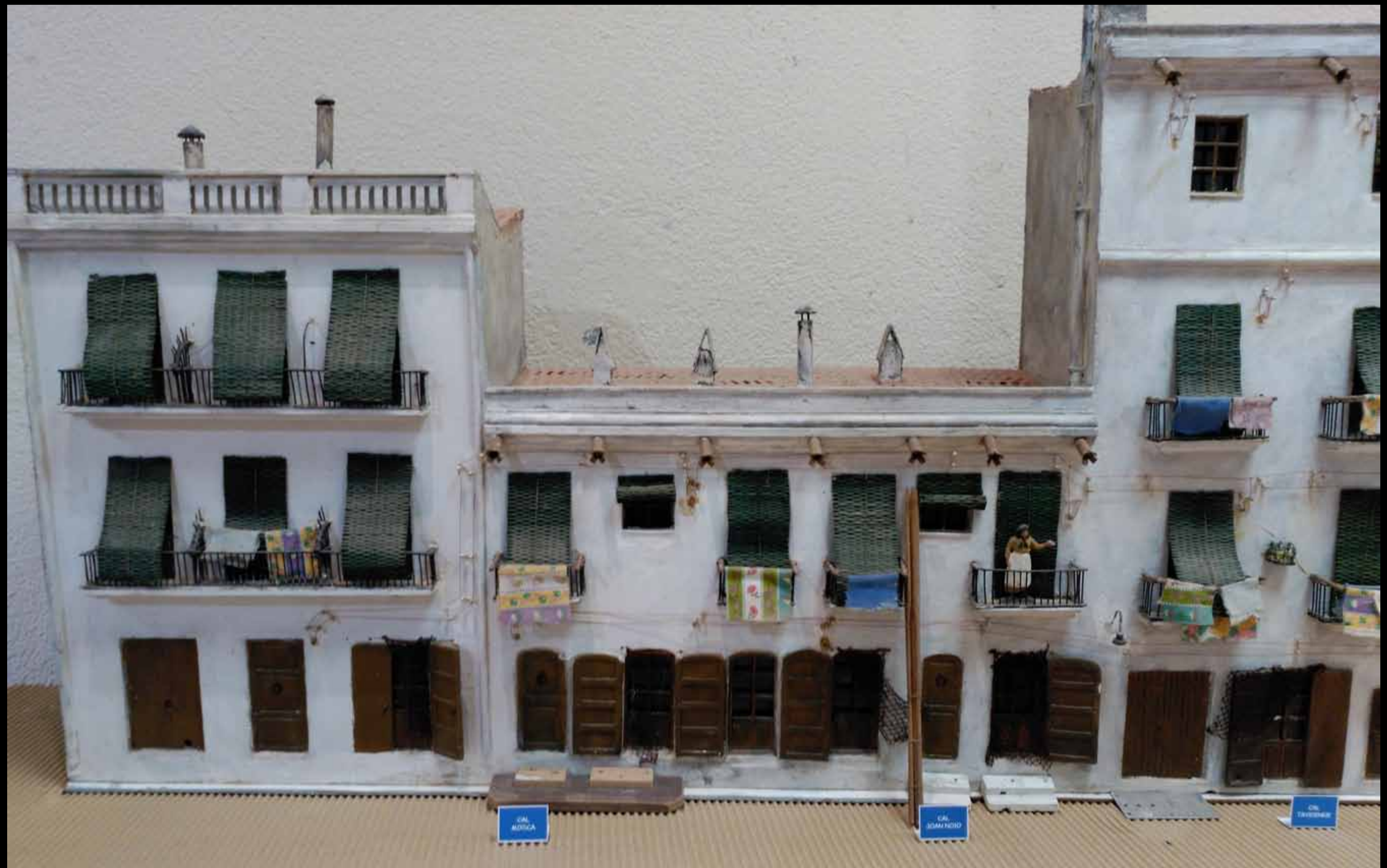
Museu d'Història de Cambrils