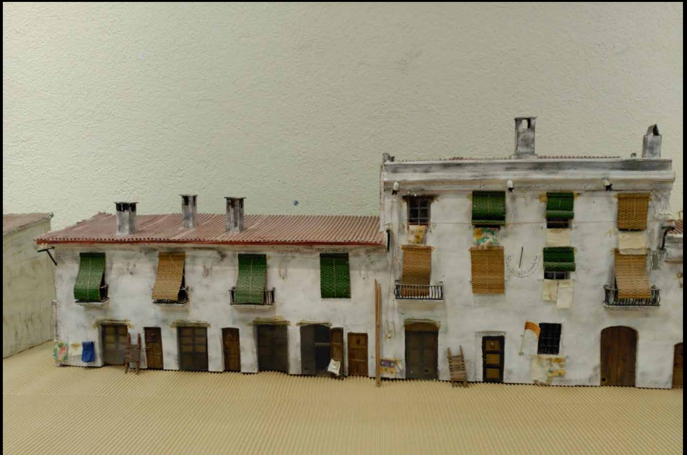
Museu d'Història de Cambrils