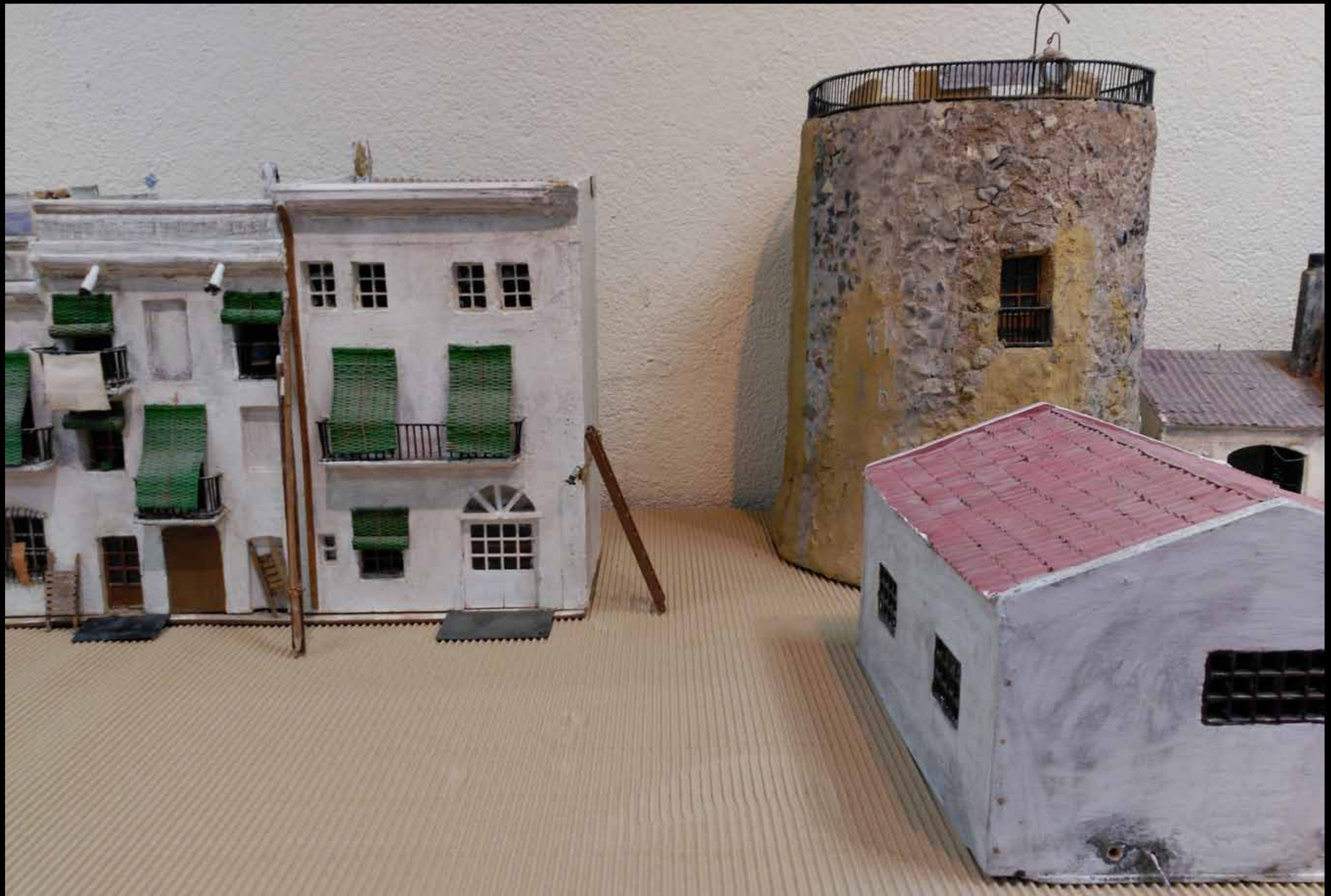
Museu d'Història de Cambrils