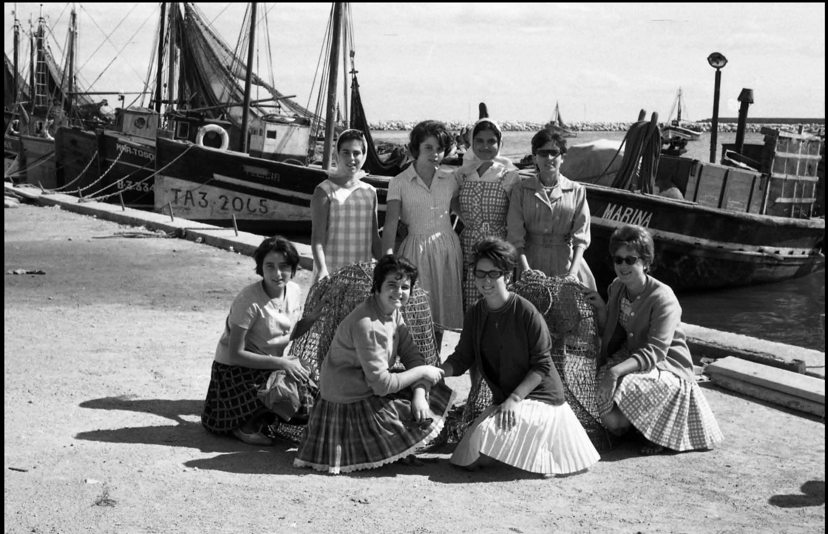
Diumenge al matí, quan feia bon temps, el fotògraf s'instal·lava al mollet del Rec i esperava que passessin les colles, les famílies i les parelles que passejaven.