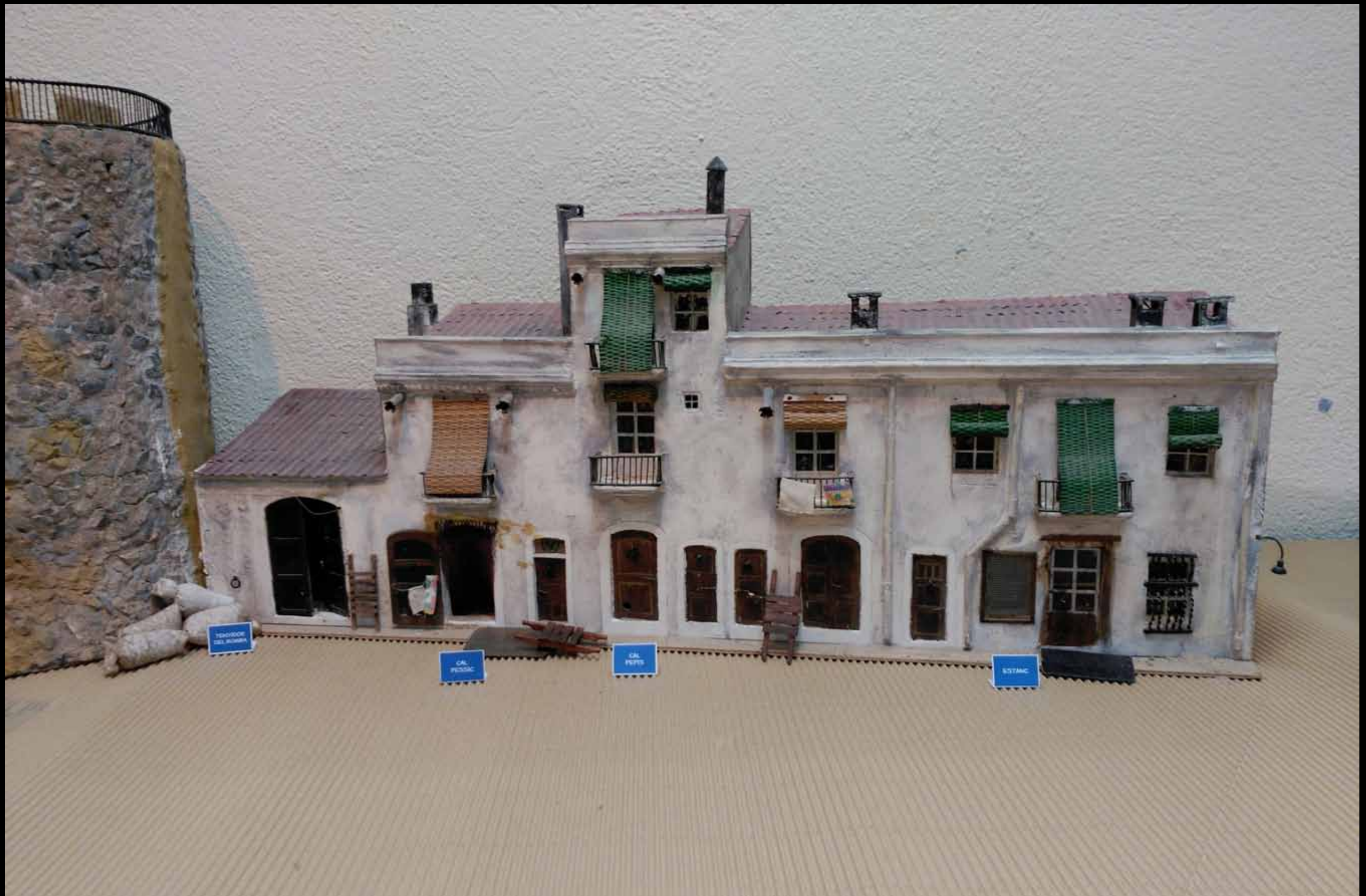
Museu d'Història de Cambrils