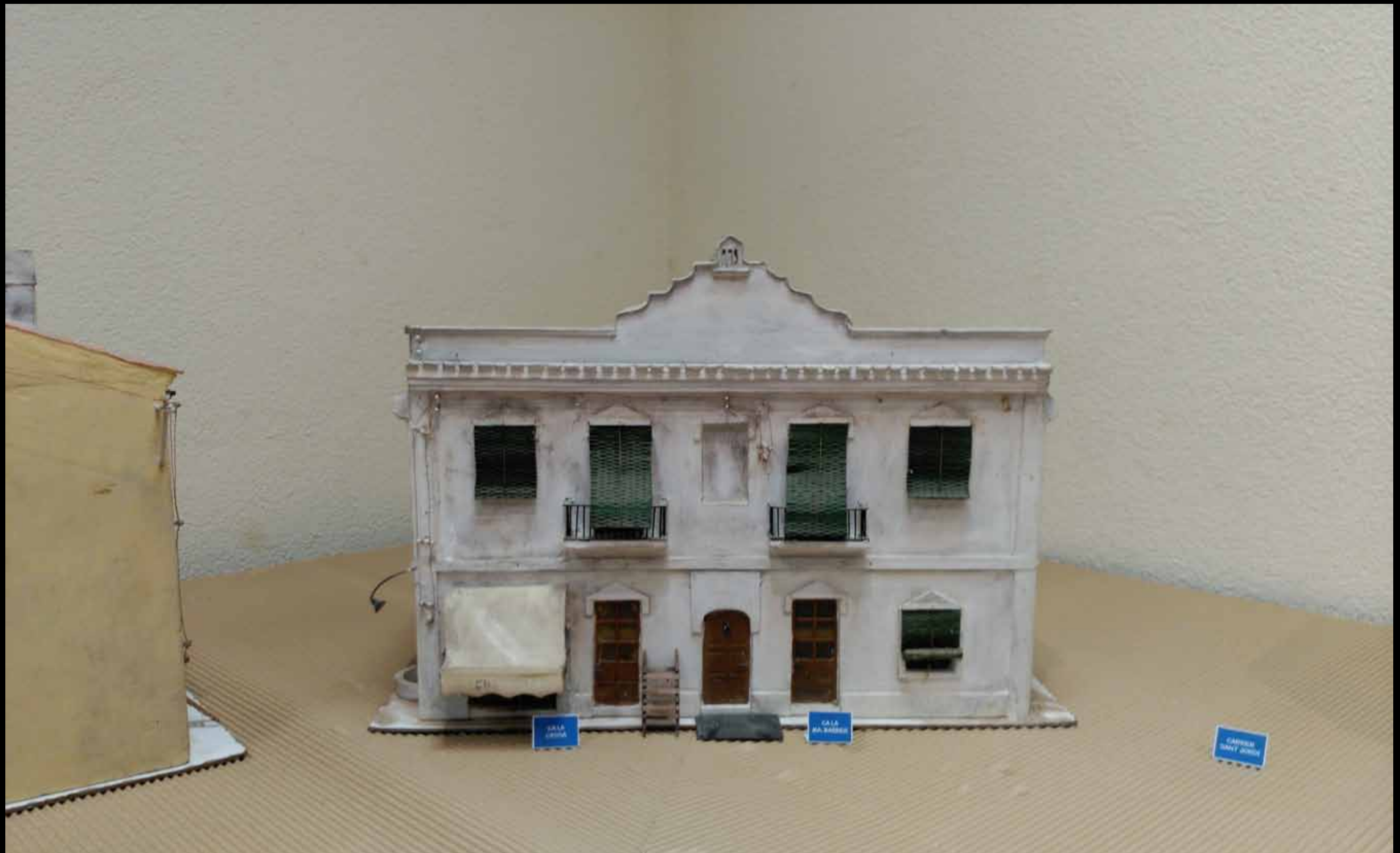
Museu d'Història de Cambrils