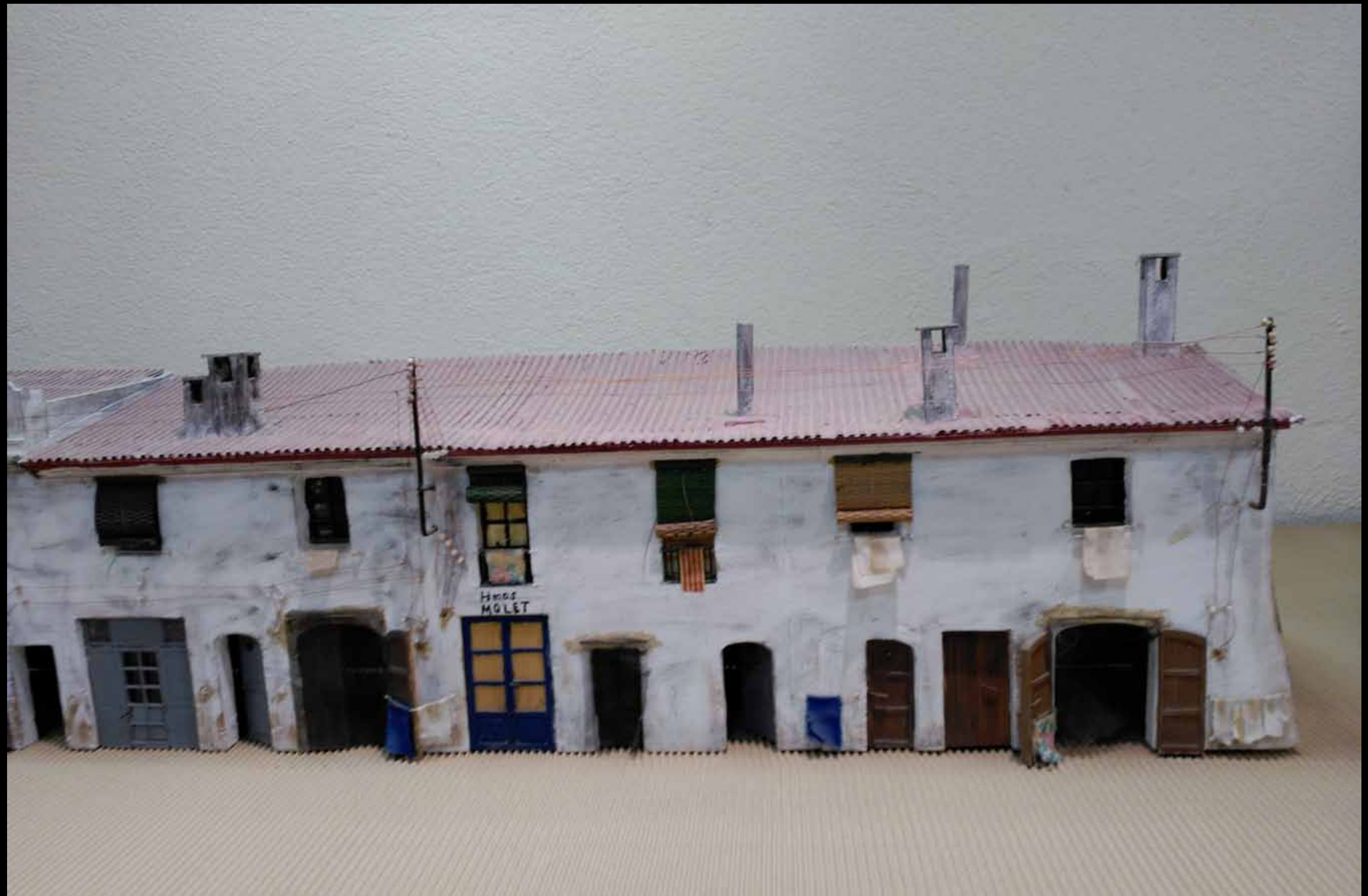
Museu d'Història de Cambrils