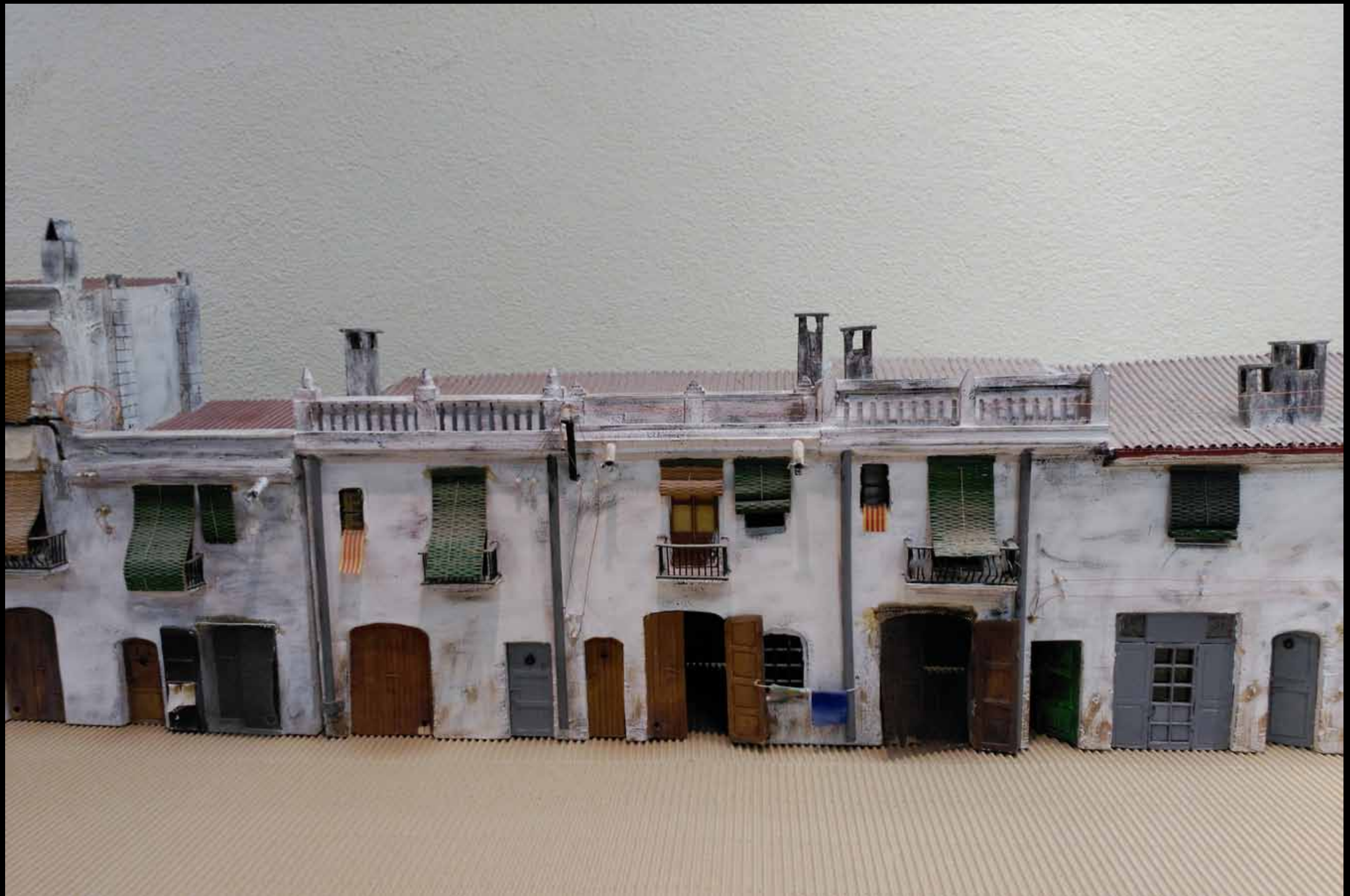
Museu d'Història de Cambrils