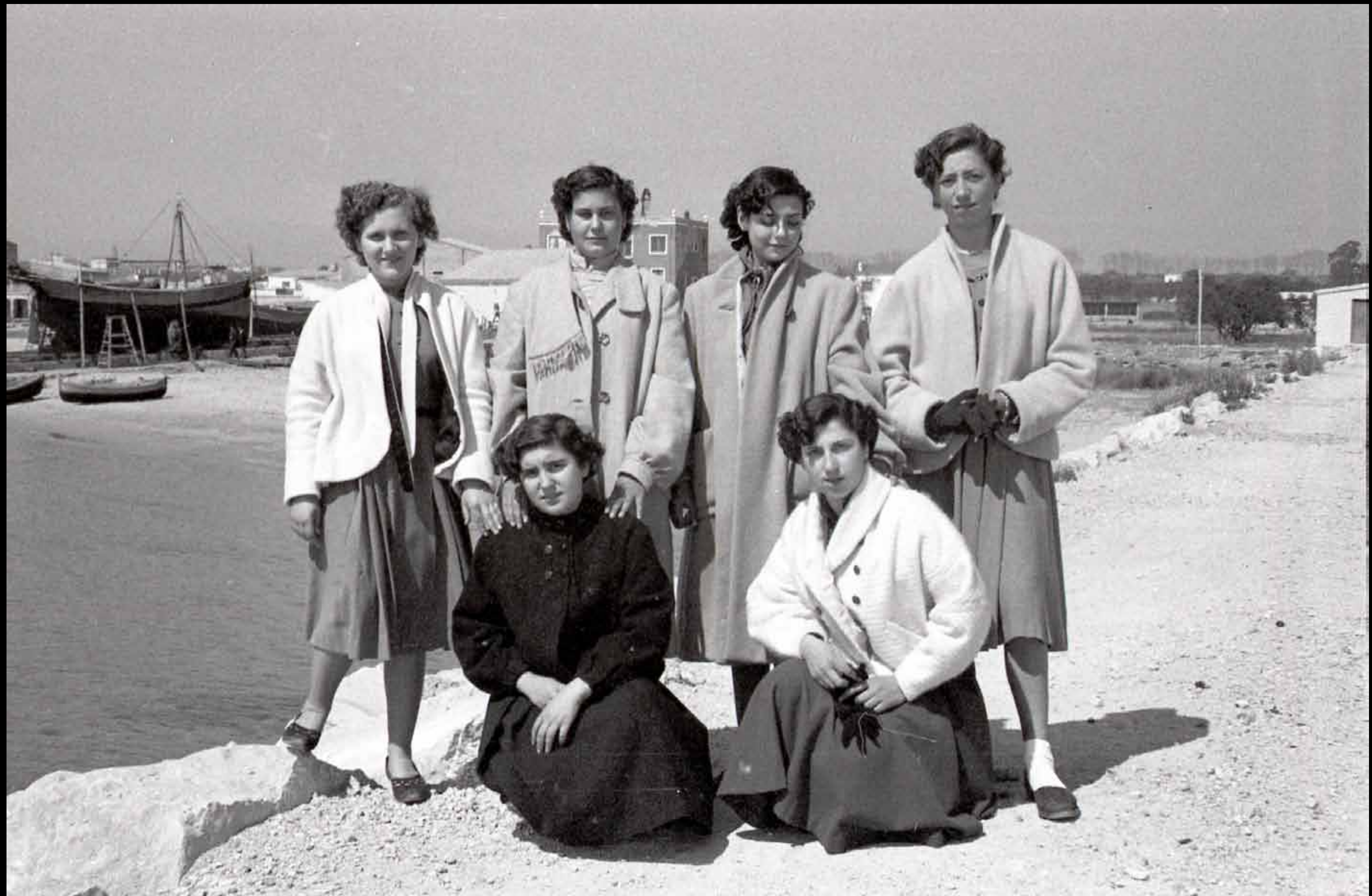
En aquesta imatge de cap a 1955 hi trobem vestits i abrics d'hivern. Xiques ben mudades i amb els cabells ben clenxinats. Darrere, el carro amb una barca treta.