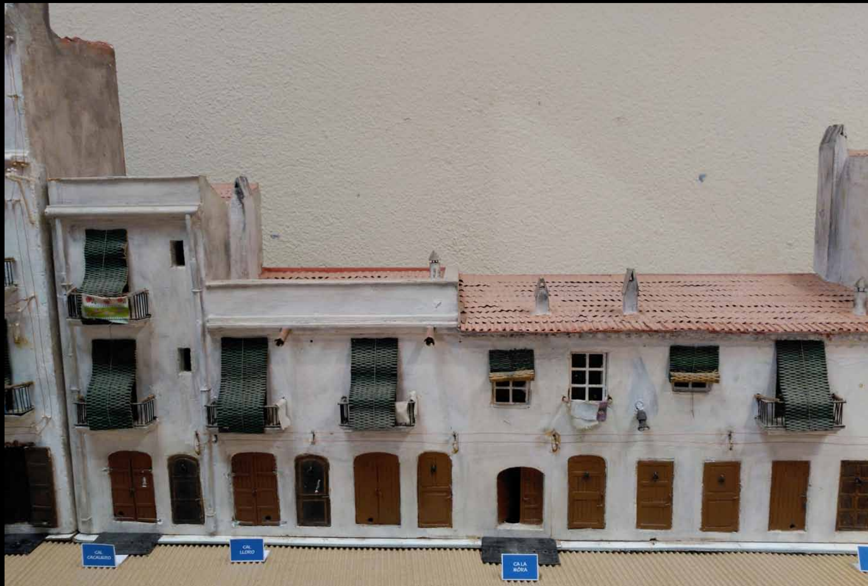
Museu d'Història de Cambrils