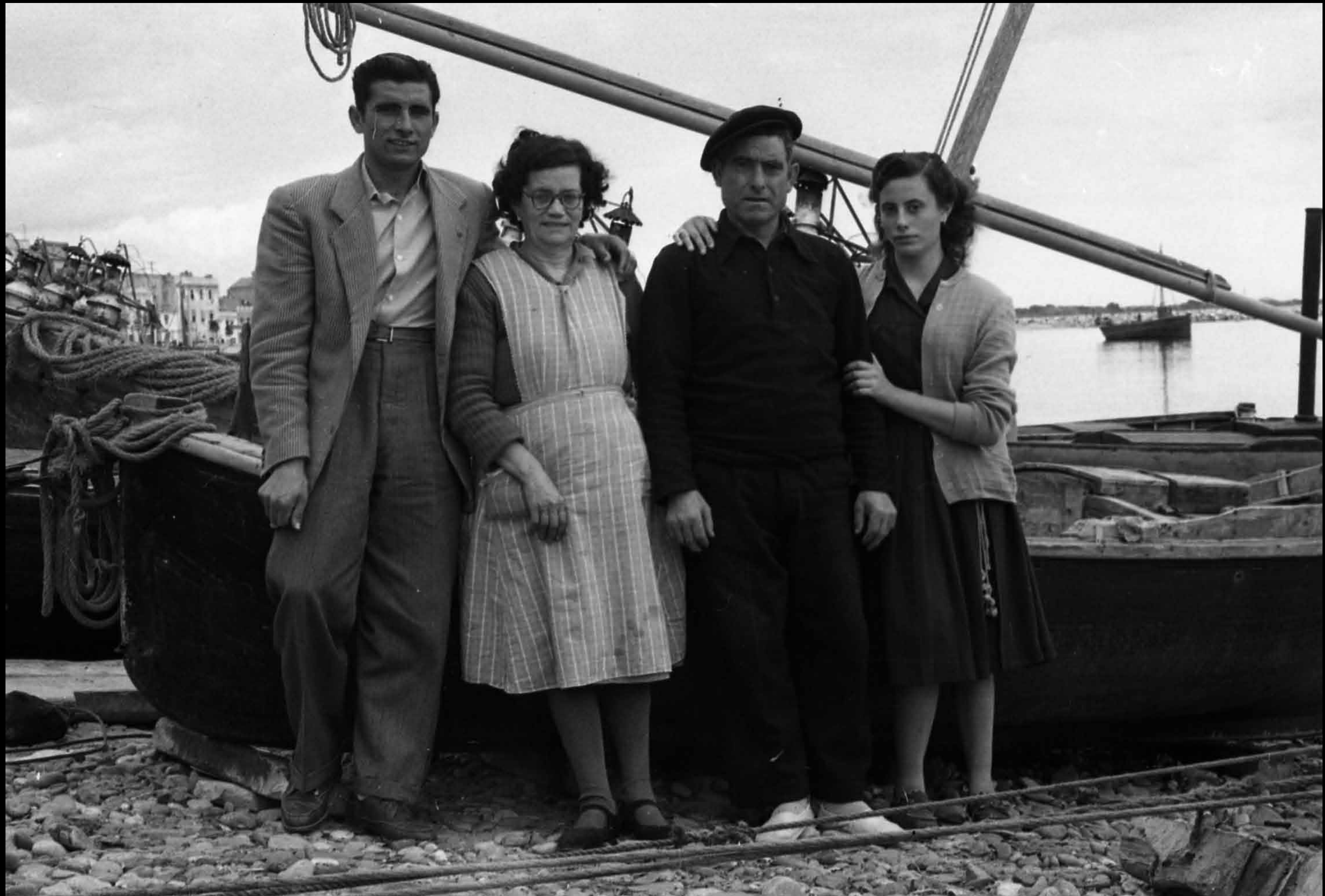
Aquesta fotografia de cap a 1960 devia correspondre també a un dia de festa. Ens ho insinua l'americana que porta el noi jove, fotografiat amb els seus pares i la seva germana.