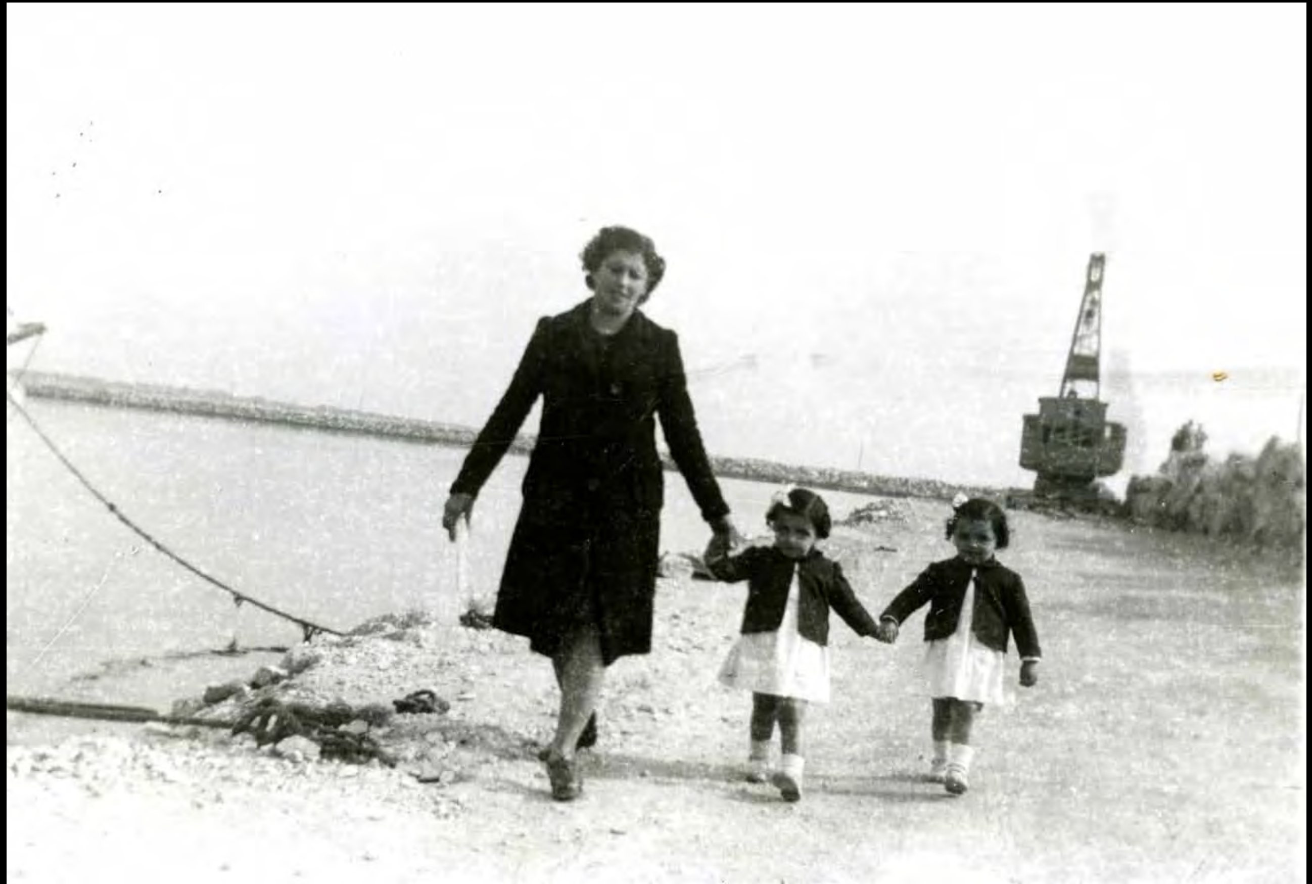
Una mare passeja amb ses filles bessones a primera línia de mar, cap a 1947. Al fons veiem perfectament una de les grues que servien per construir el moll.

Arxiu Municipal de Cambrils (cedida per Montserrat Marco Vaquero). Núm. Reg. 10725-2-002. Autor desconegut