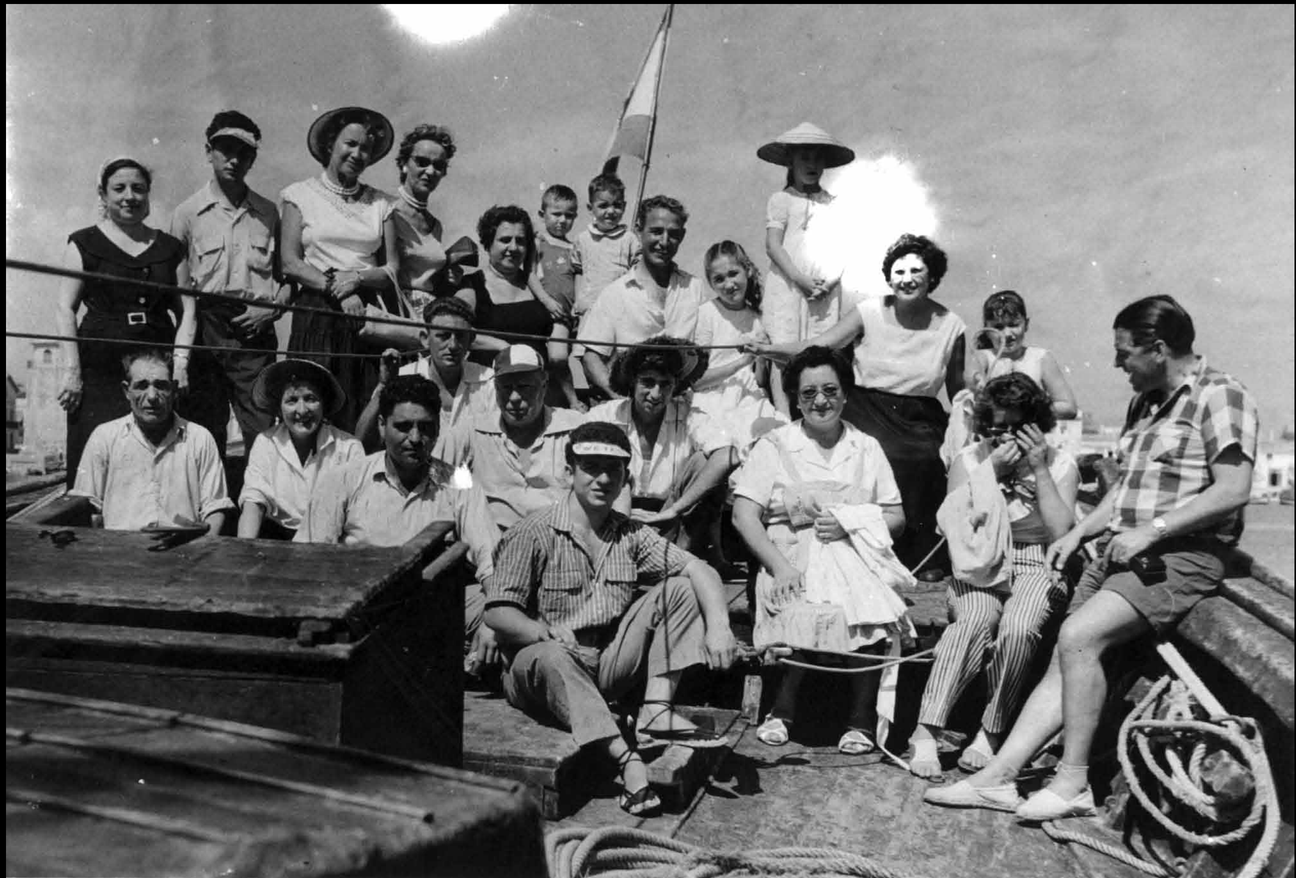
Estrena de la barca Marisol, el 1958. Presideix la dona de l'armador, vestida amb davantal i asseguda entre amics i parents. Aquest dia de festa, tan assenyalat per a l'economia de les famílies pescadores, era una de les poques ocasions en què la dona pujava a la barca.