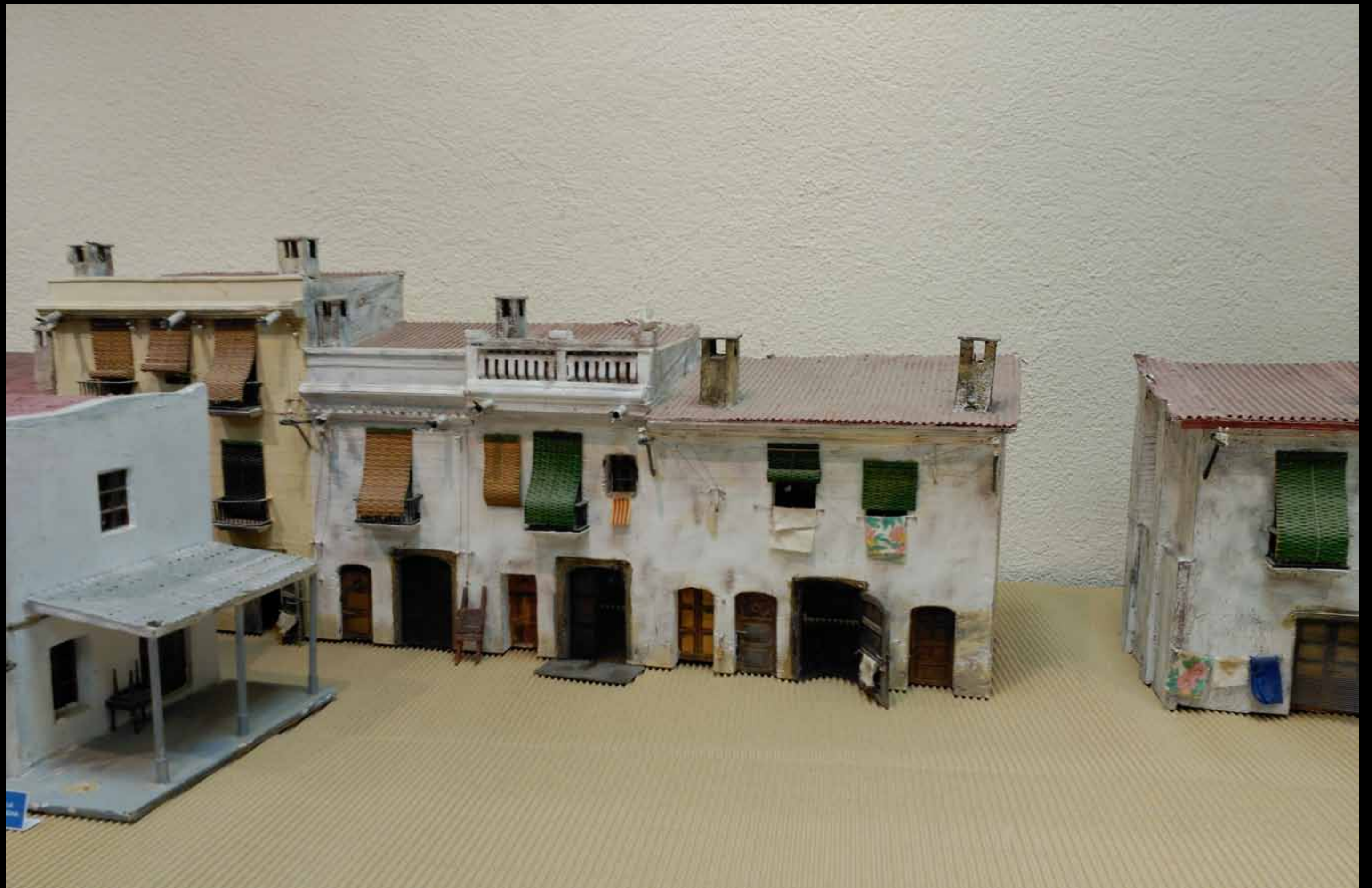
Museu d'Història de Cambrils