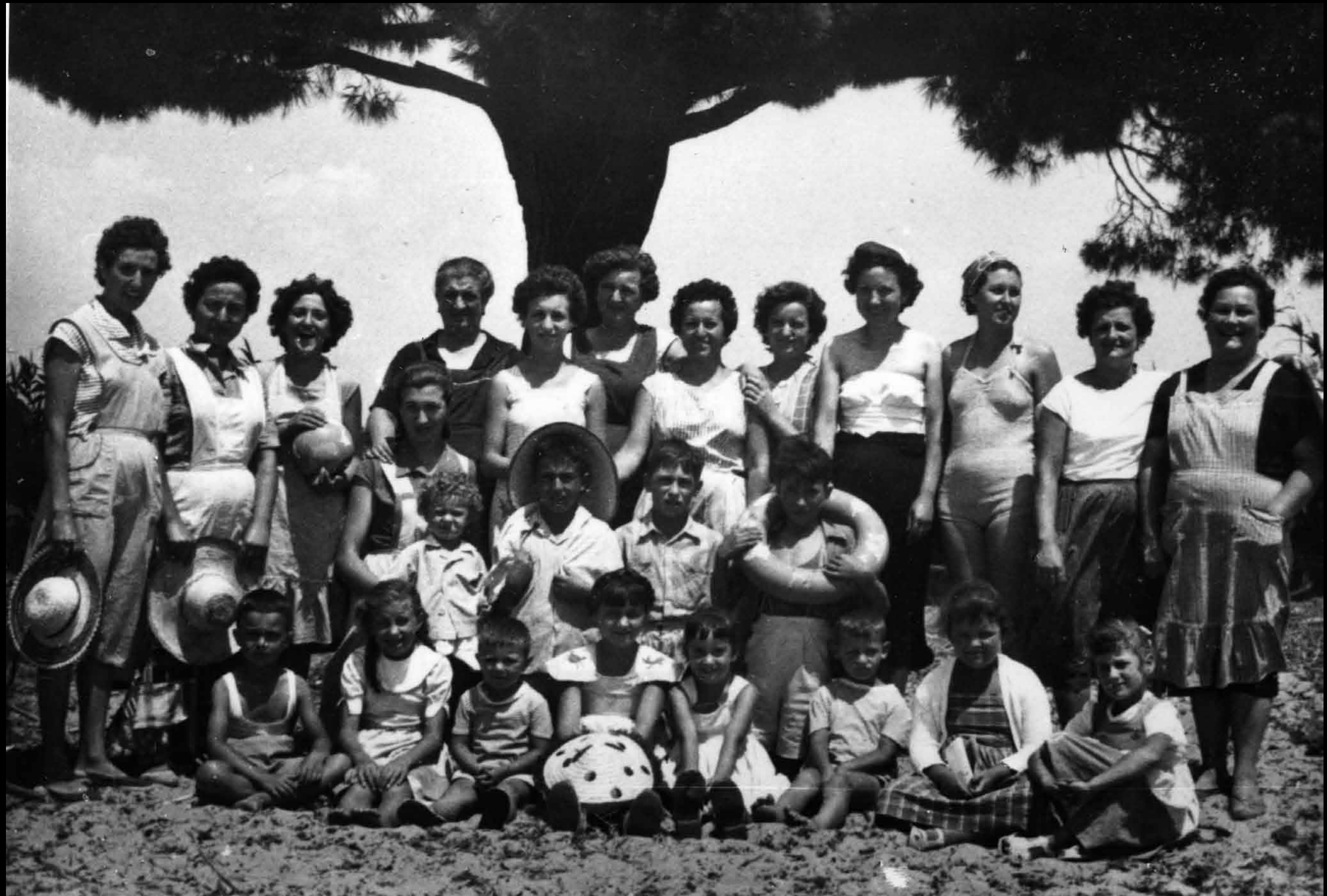
Cap a 1960, les dones de la Platja i la seva canalla anaven a passar qualsevol matí d'estiu al Cavet. Buscaven auriçons, feien la tequeta, es banyaven... I un dia els van retratar.