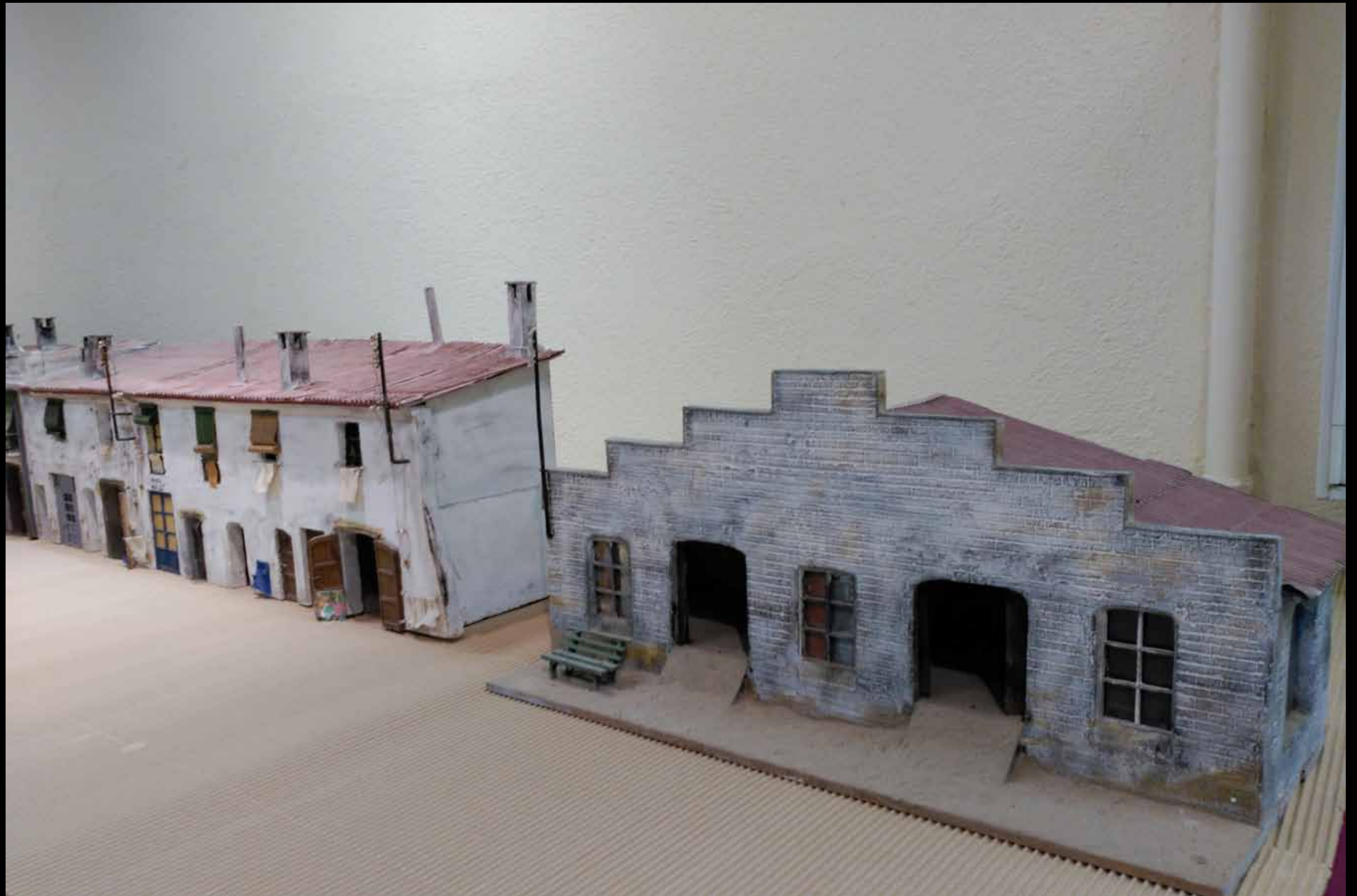
Museu d'Història de Cambrils