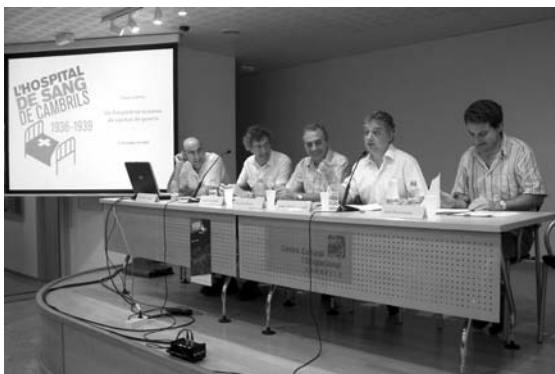
Els participants a la taula rodona.