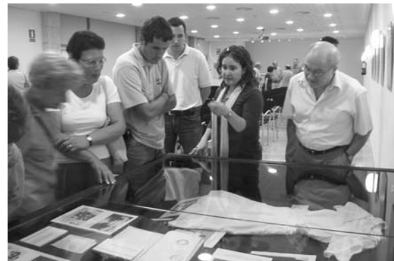
Visitant una de les exposicions.