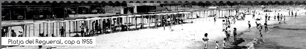
Platja del Regueral, cap a 1955

El cicle L'arribada del turisme a Cambrils (1950-1962) pretén començar a donar a conèixer com es va desenvolupar aquella primera dècada de l'auge turístic, gràcies al testimoni de les persones que hi van estar directament relacionades i, també, a la documentació textual i gràfica que se'n conserva.