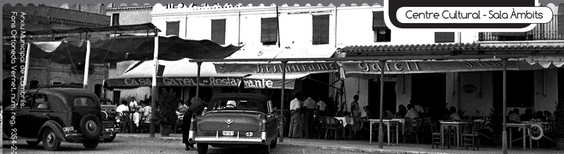
Passeig Miramar, cap a 1955